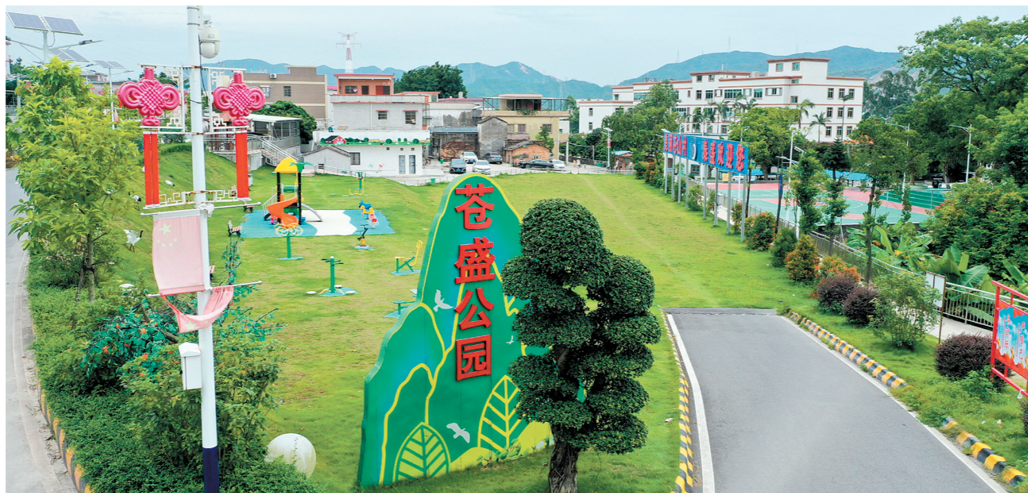
泰盛石场捐建的村企共建苍盛公园项目，极大改善了苍山村的村容村貌。

秉承“建起一方、造福一方”的使命，泰盛石场为改善矿区周边居民的生活，捐资兴建了崖门文化中心、崖山公路，全资建设苍山村村路改造项目和海事船员活动中心。与此同时，泰盛建造有游泳池、篮球场、健身房、图书馆和音乐减压室等文体娱乐和健康福利设施，经常