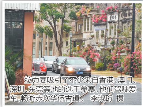
拉力赛吸引了不少来自香港、澳门、深圳、东莞等地的选手参赛，他们驾驶爱车，畅游赤坎华侨古镇。