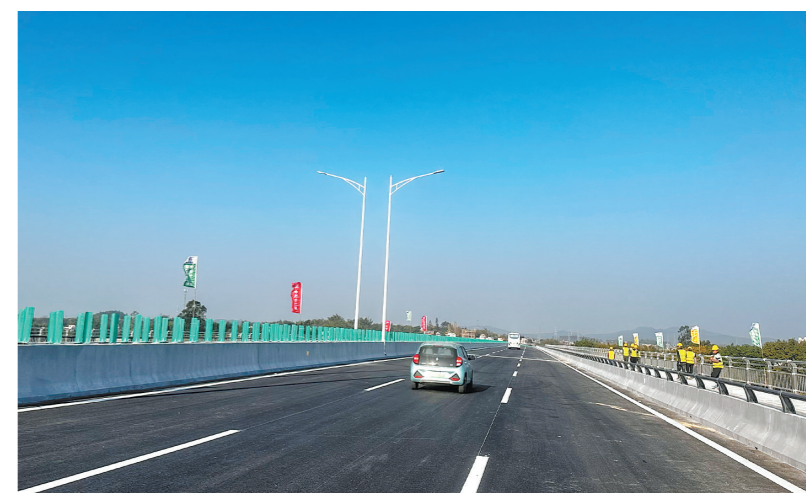
赤坎大道通车后,将大大缩短游客往来赤坎华侨古镇的时间。