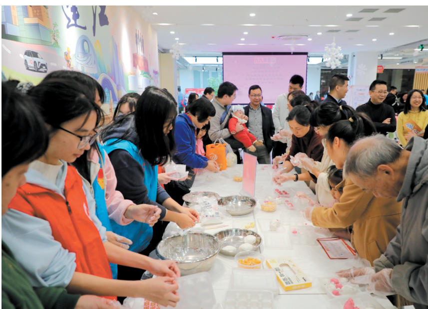
江门市“蓬友圈”党群服务中心举办“党群百家亲 暖冬邻里情”社区生活节冬至专场活动。

格员和楼长走访入户，通过召开党建联席会、居民代表会等方式，收集意见建议。针对社区老年人较多情况，该社区联合五邑中医院、白沙街道仓后社区卫生服务中心等医疗机构定期举办中医养生专题讲座、义诊活动；围绕上班族的需求，策划“党群小夜校”；面对即将到来的寒假，谋划趣味寒假班……如今，丰乐社区能够更好地满足居民的多元化需求。