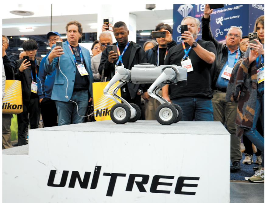
1月8日，在美国拉斯维加斯，人们在宇树科技展区观看机器狗展示。

础。对于听障人士，海信智能系统可以生成准确及时的多语言字幕；对于视障人士，也可以实时解析视频内容并播报，从而让AI技术更有温度。 作为本届展会展位面积最大的中国品牌，TCL参展面积超过2300平方米，展示前沿显示、AI应用、全品类智能物联生态等技术、产品及解决方案。 TCL现场展示了一款分体式AI陪伴机器人TCL Ai Me，它可爱的造型吸引了大批参观者。据介绍，这款产品不仅能实现与人的多模态自然交互，还能提供情感陪伴、智能控制家电等功能。 TCL董事长李东生表示：“AI的真正价值在于应用。TCL聚焦关键方向构建AI核心能力，解决实际业务需求。中国企业要通过‘创新破万卷’，推动技术突破，实现超越和领先，避免低层次竞争。” 京东方携60余款创新技术产品及多元物联网场景技术解决方案参加此次展会，并首次面向海外发布针对智能汽车时代应用场景的“HERO”计划。京东方凭借车载拼接柔性显示获评本届CES创新奖。 众多中国初创企业和中小企业也积极投身人工智能发展的浪潮，努力以新技术提升产品的国际市场竞争力。来自上海的星纪魅族在展会上展示了自己在AI及增强现实融合领域的进展，推出的新款AI智能眼镜可以实现多语种实时对话翻译和语音转写，令许多参观者赞