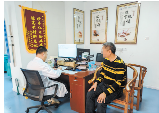
蓬江区环市街道社区卫生服务中心中医科充分利用中医药资源,推广中医治未病。

江门日报讯(文/图 记者/何雯意 通讯员/林影秀)近日,2024年江门市基层特色专科名单公布。经组织机构申报、专家评审,10家基层医疗卫生机构专科入选,其中蓬江区环市街道社区卫生服务中心中医科榜上有名。