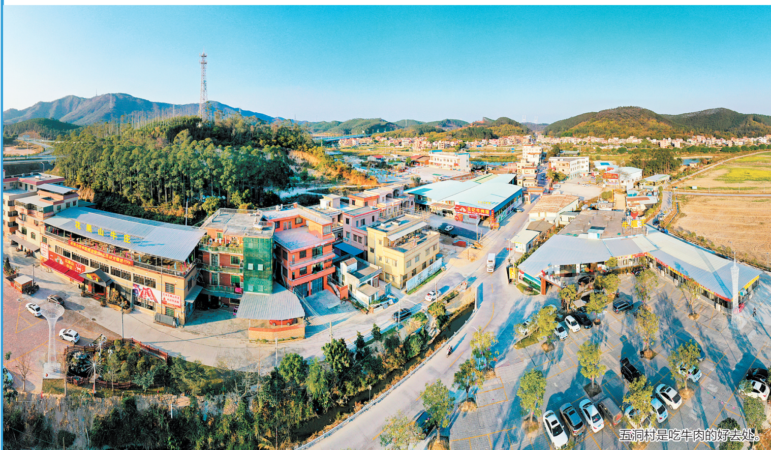
五洞村是吃牛肉的好去处。