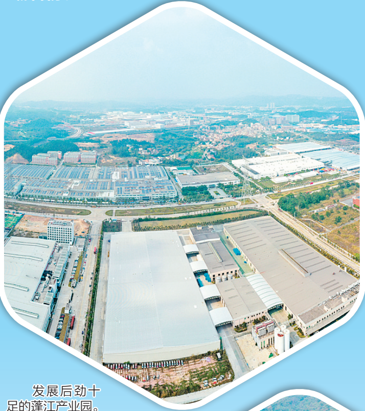
发展后劲十足的蓬江产业园。