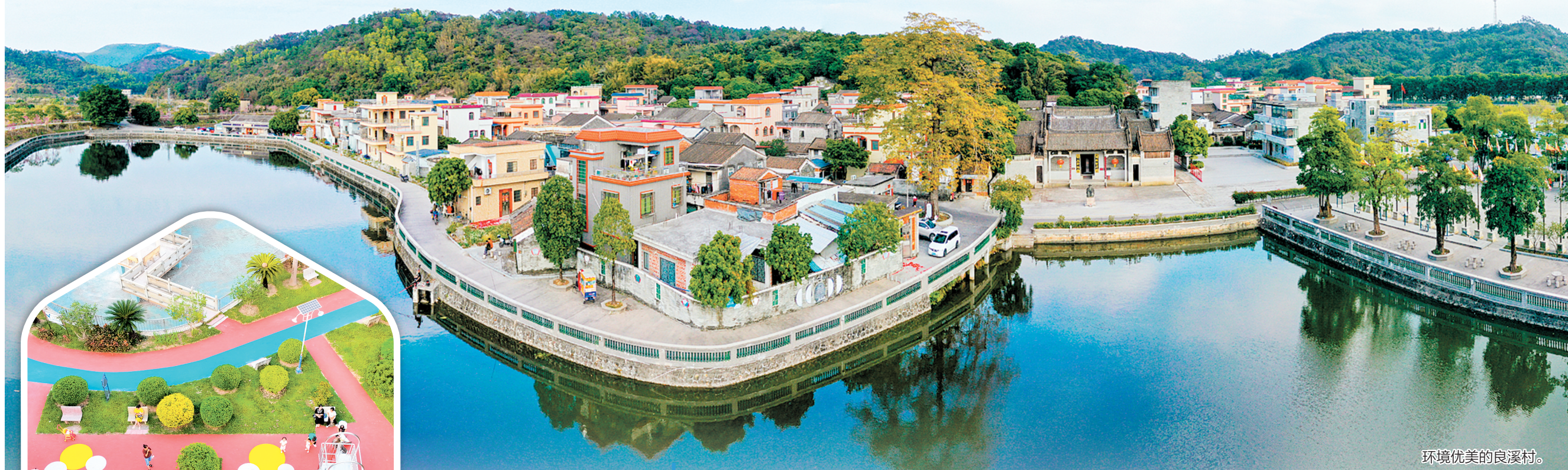
环境优美的良溪村。