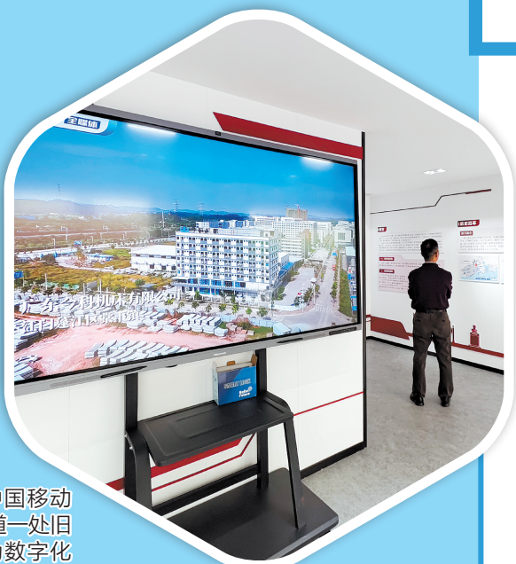
棠下镇和中国移动合作，将棠下大道一处旧办公场地打造为数字化城市客厅。