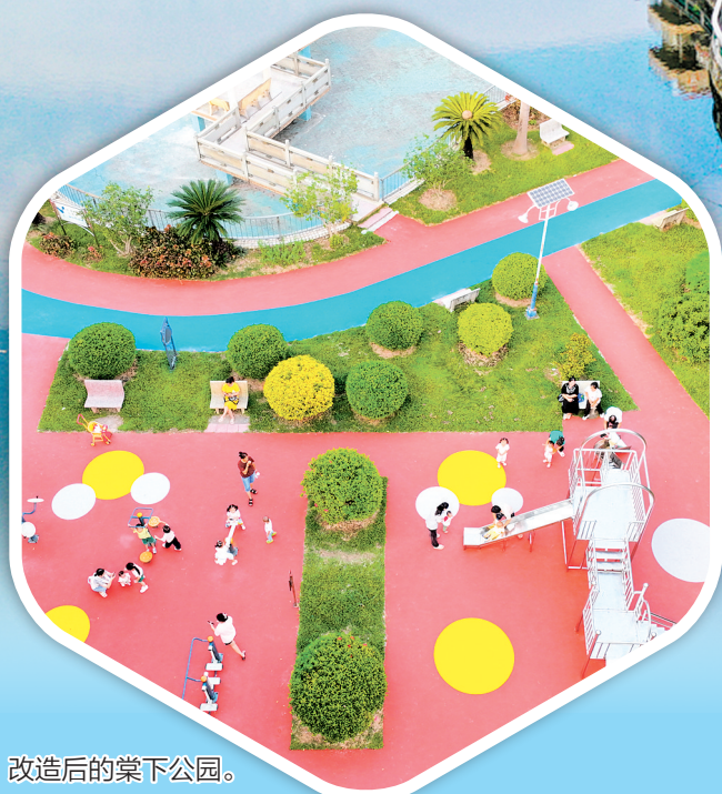
改造后的棠下公园。