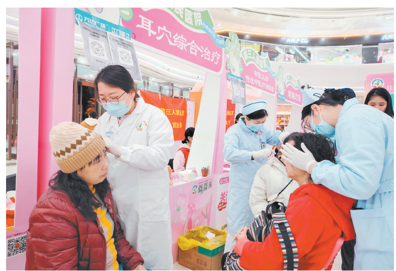
本次活动设置了多个健康服务摊位。

江门日报讯（文/图 记者/梁爽 通讯员/麦润萍 朱嘉茵）3月8日晚，江门市第三人民医院于蓬江万达广场举办“凝聚巾帼力量，关爱女性健康”身心健康夜市活动，为广大市民群众送上健康的关怀与祝福。 活动现场温馨热闹，江门市第三人民医院心理科、内科、老年科、神志病专科、康复专科等专科医疗团队“火热开摊”，设置了多个健康服务摊位，包括心理咨询、睡眠咨询、沙盘体验、绘画疗愈、中医辨证义诊、中医刮痧、耳穴综合治疗、老年科义诊、老年综合征筛查、血糖血压测量、精神康复政策宣传等，为女