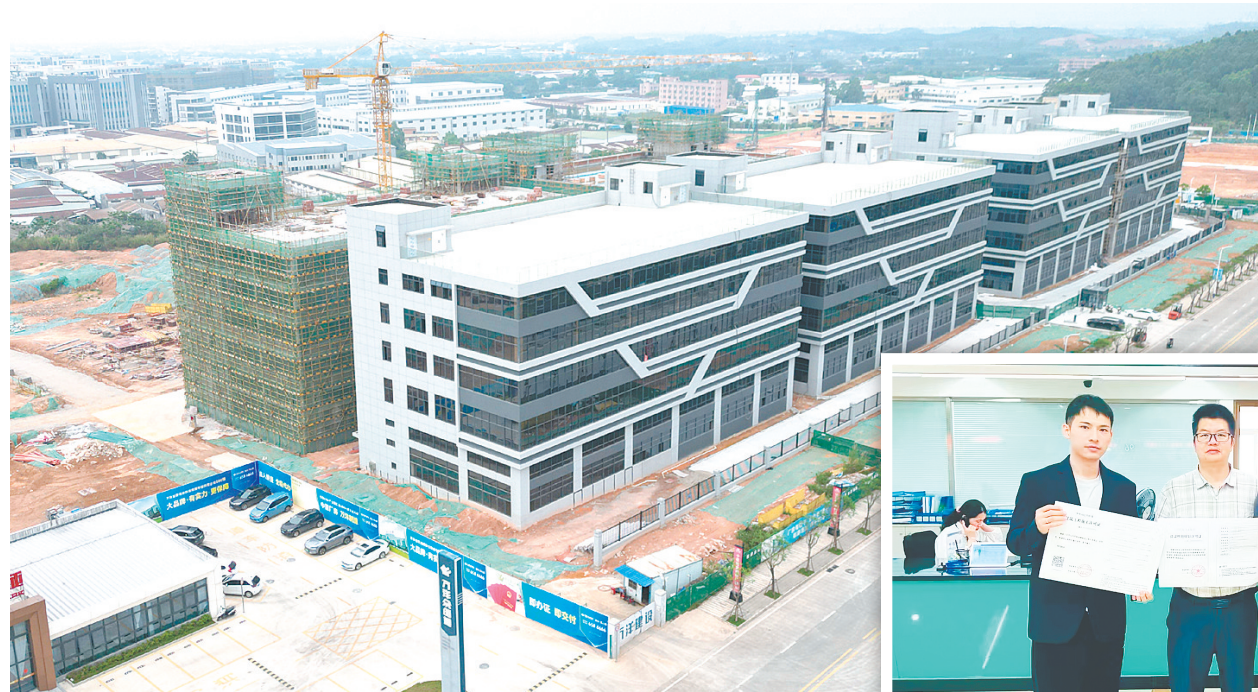
◀万洋众创城施工现场。

“政策工具箱”同步发力。“容缺受理+告知承诺制”允许非关键材料暂缺时先行受理,同步审查;“分阶段报建”政策让康利邦、优普特等24个