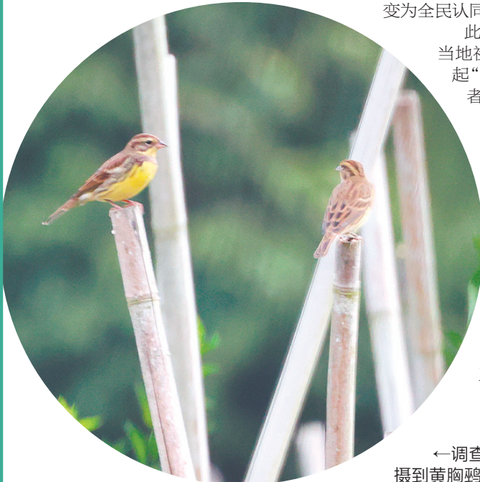
←调查人员首次在小鸟天堂拍摄到黄胸鹀。

此外，小鸟天堂还积极联动当地社区、学校及环保组织，发起“护鸟小卫士”“候鸟守护者”等公益项目，累计培训护鸟志愿者200余人，发放生态保护宣传手册数万份，在全社会营造出“人人参与、共建共享”的良好保护氛围。“我们将持续加强湿地生态监测和生物多样性保护的力度，同时通过多元化的科普活动传播生态理念，诚邀社会各界共同守护这片‘鸟的天堂’。”王国丽说。