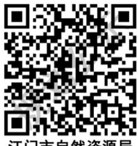
江门市自然资源局 规划公示网址