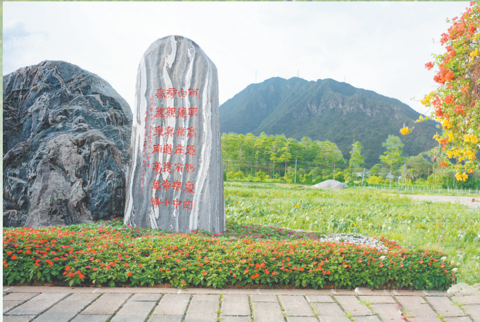
陈白沙景观石是城西村的网红打卡点。