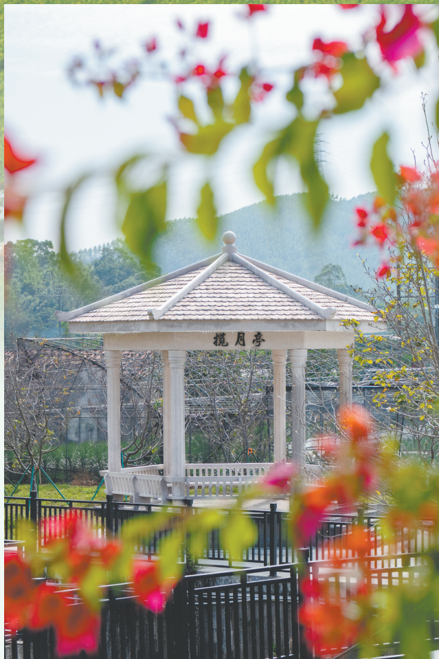
位于樱花河堤边上的揽月亭，与揽月池、大昆仑山和小昆仑山遥相呼应。

← 揽月池是城西村打造乡村景观的代表性项目之一。通过发动本村华侨和乡贤助力，结合自身资源特点建成。