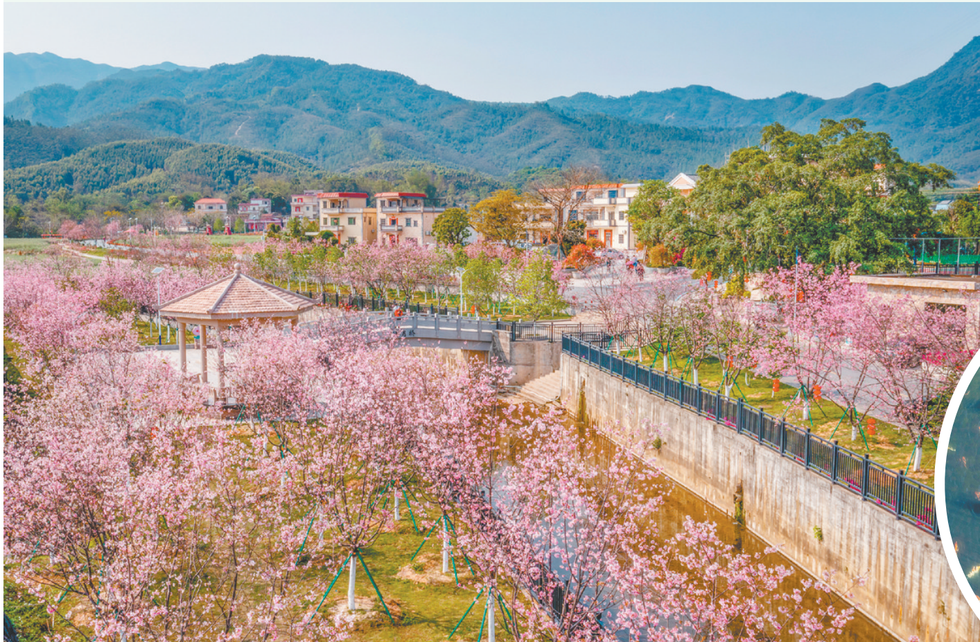
樱花河堤位于城西村范屋、谢屋村，是进入七麓井景区的必经之路。