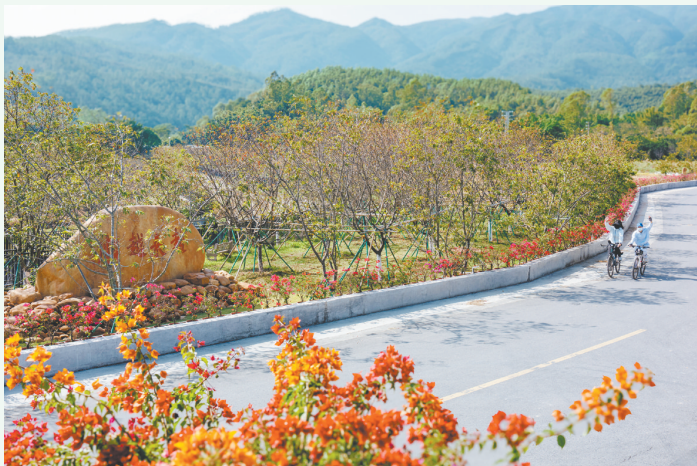
村道漂亮了，不少车友从沙坪骑行到城西村，呼吸这里清新的空气。