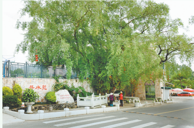
去年，在乡贤的大力支持下，对井水龙进行了修缮，周边铺了石板、种了绿植，以及装了抽水机及水龙头，方便村民取水。