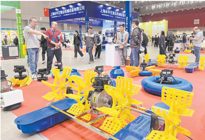
展区展示的水车式增氧机受到嘉宾关注。

江门日报讯（文/图 记者/朱磊磊）11月24日，第九届江门市水产高质量发展暨智慧渔业科技展示活动（第三届国际水产养殖（江门）博览会）在江门珠西国际会展中心举行。