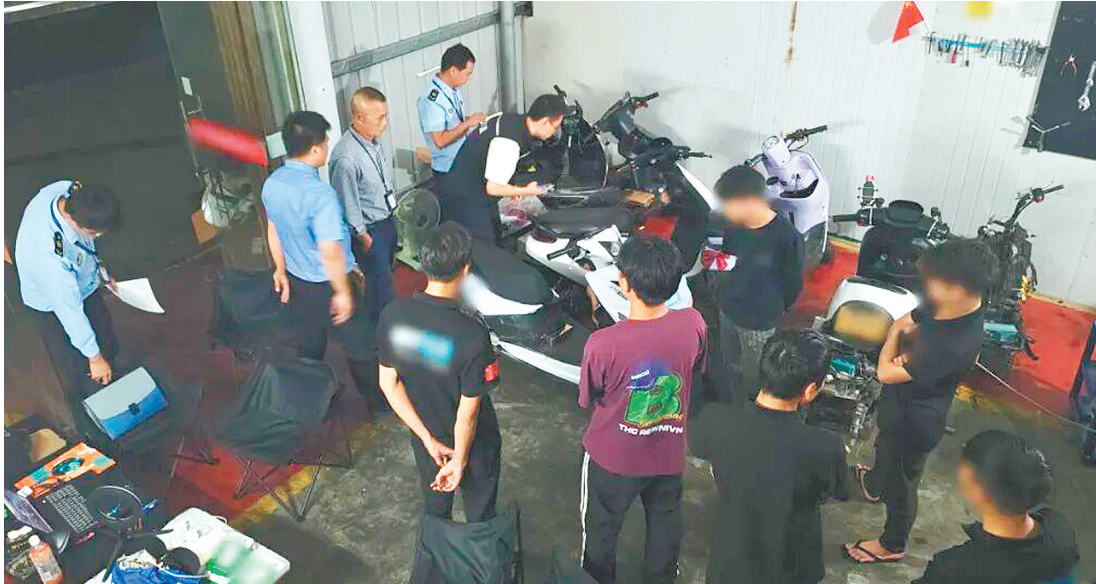
江海区组织联合执法，查处电动自行车非法改装行为。

承办检察官针对这一乱象深入开展调查，发现江海区辖区内存在如下主要问题：一是电动车辆交通事故占比呈逐年增加态势，查处非法改装车辆的道路违法行为中，以电驱动的摩托车占比逐年攀升，严重扰乱交通秩序，影响公共安全；二是开展非法改装电动摩托车业务的多数为一一些仅租赁小型店面的维修店，大部分为无证经营且未向交通运输部门备案，通过网络直播时遭人举报才被发现，查处难度大；三是参与非法改装和驾驶改装电动摩托车的群体主要为青少年，往往伴随无证驾驶、驾驶无牌车辆、危险驾驶等多重违法行为。