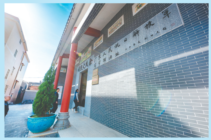
靖村村深挖广东人民抗日解放军司令部旧址的红色底蕴，精心打造红色旅游路线。