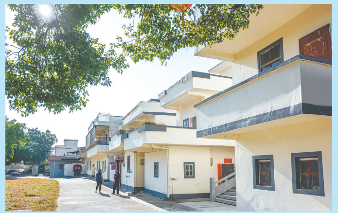
靖村村开展农房风貌品质提升行动，推动农村人居环境提“颜”增“质”。