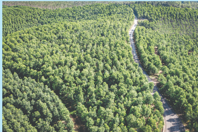
靖村村引入联威沉香生态茶园项目，规模化种植沉香。