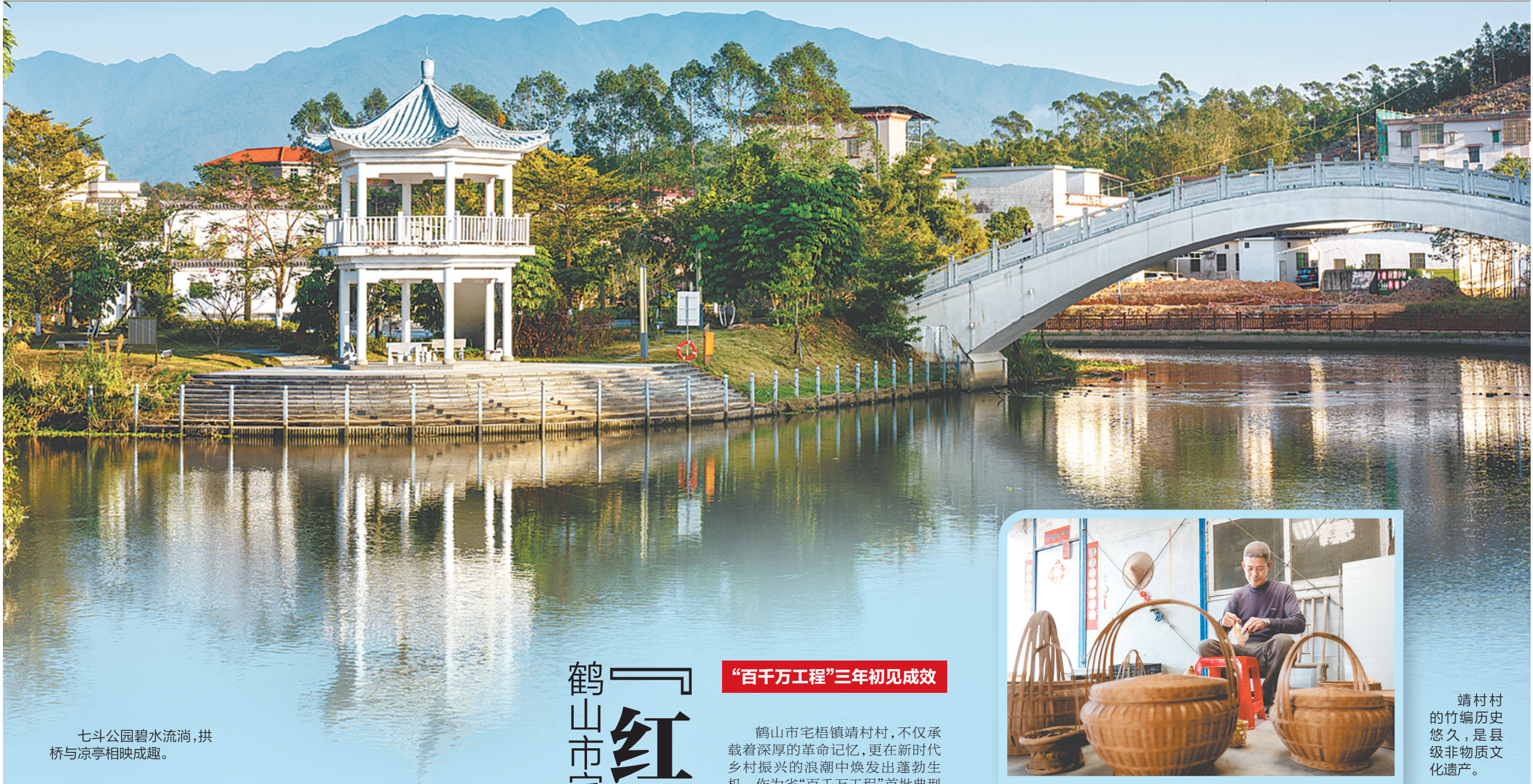
七斗公园碧水流淌，拱桥与凉亭相映成趣。