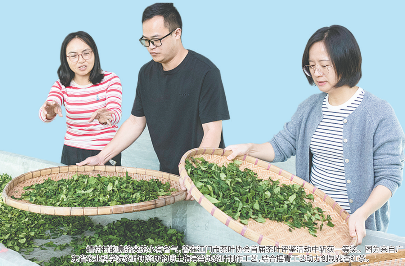
靖村村的康路尖茶小有名气，曾在江门市茶叶协会首届茶叶评比活动中斩获一等奖。图为来自广东省农业科学院茶叶研究所的博士指导当地茶叶制作工艺，结合摇青工艺助力创制花香红茶。