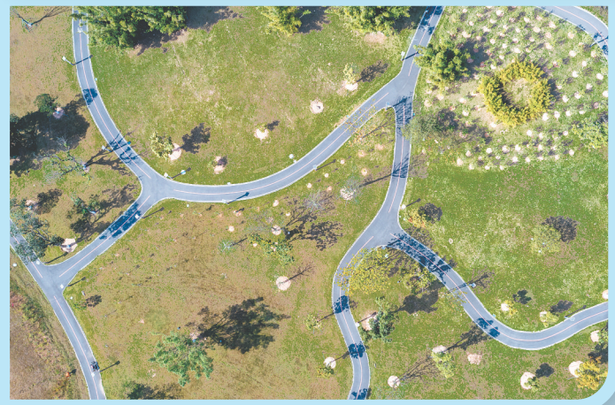
半岛公园建有儿童公园、乡村舞台、红茶码头等文旅设施。