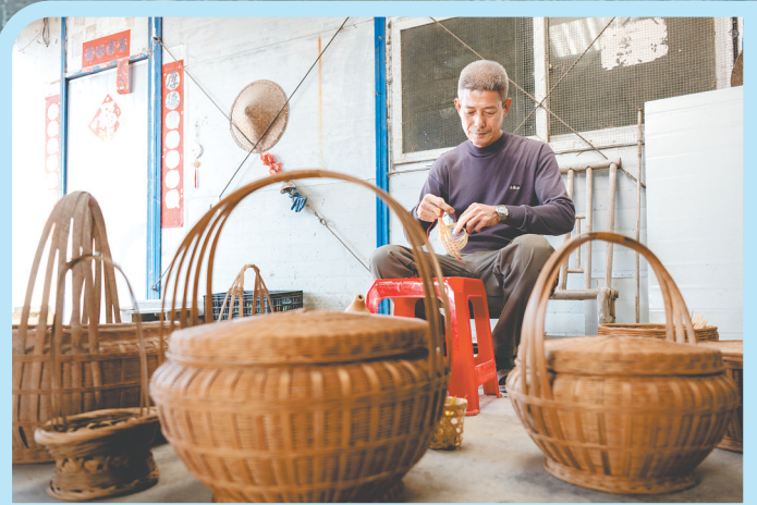
靖村村的竹编历史悠久，是县级非物质文化遗产。