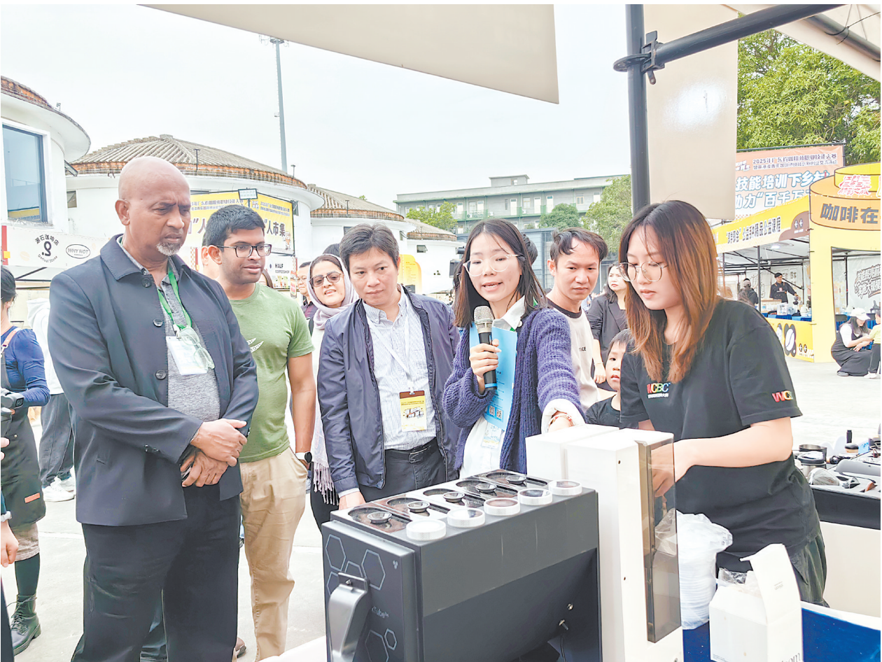
外国友人被活动现场的智能拼豆机所吸引，点赞侨乡江门创新活力。