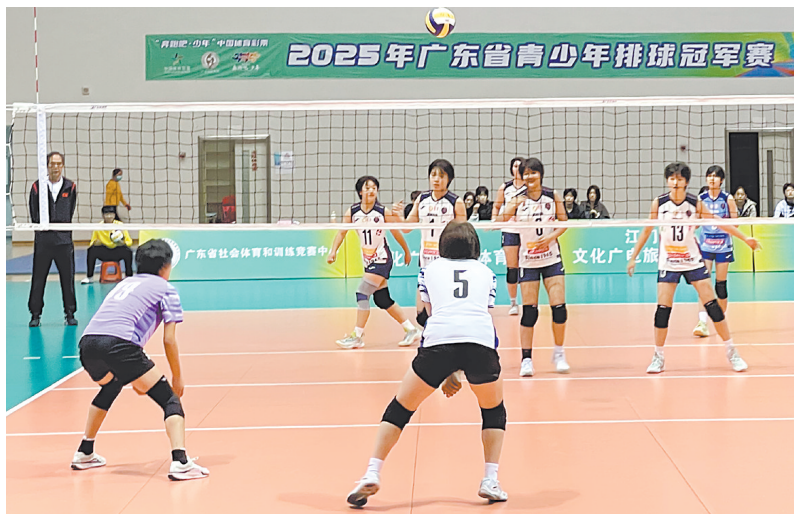
赛场上,选手们激烈比拼,赛出了水平。

江门日报讯(文/图 记者/李嘉敏) 距离第十五届全国运动会排球(男子成年组)赛事圆满落幕仅半月,“中国排球之乡”江门市再度迎来高水平赛事。12月4日至11日,“奔跑吧·少年”2025年广东省青少年排球冠军赛在台山开赛,全省40支排球劲旅500多名运动员展开角逐,赛事成绩将作为运动员技术等级申报的依据。