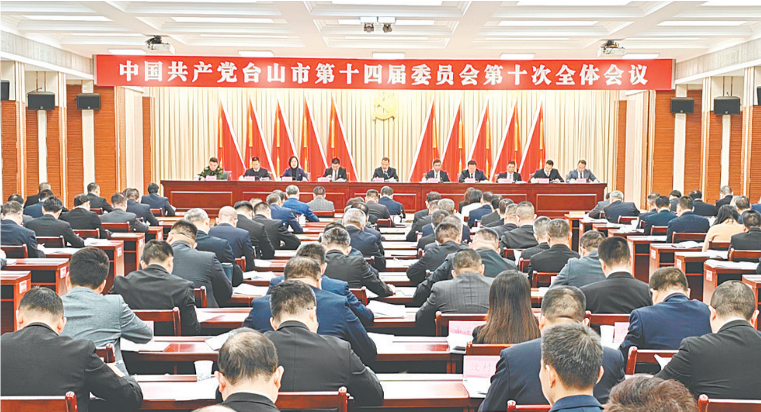
12月16日,中国共产党台山市第十四届委员会第十次全体会议召开。

五要在开拓县域、开发海洋上取得重大突破,促进城乡区域发展更趋协调平衡。纵深推进“百千万工程”,提速推进以县城为重要载体