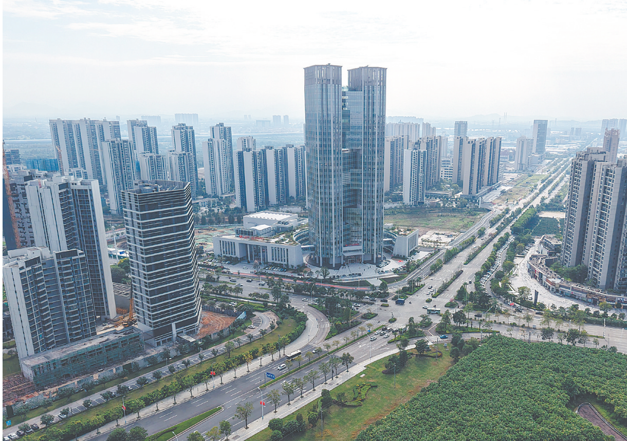
珠西枢纽新城。

中心的发展思想，抓实抓细农贸市场管理、消防安全、食品安全等群众关切，让群众获得感、幸福感、安全感更加充实、更有保障、更可持续。要把文明城市建设与推进“百千万工程”、基层治理工作结合起来，逐步完善城市精细化管理、长效化治理机制。要加大宣传力度，推动文明理念入脑入心，营造人人参与、人人支持文明城市建设的良好氛围。