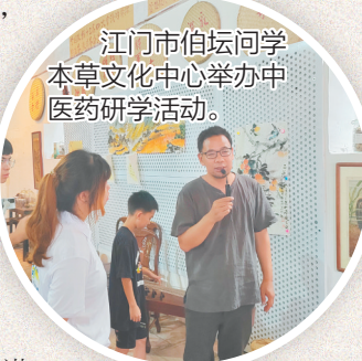
江门市伯坛问学本草文化中心举办中医药研学活动。

下一步,江海区将继续深化陈伯坛中医药文化薪火传承工程,进一步拓展中医药服务场景,深化粤港澳中医药合作,让中医药文化在传承中创新、在创新中发展,为构建健康中国、弘扬中华优秀传统文化贡献江海力量。