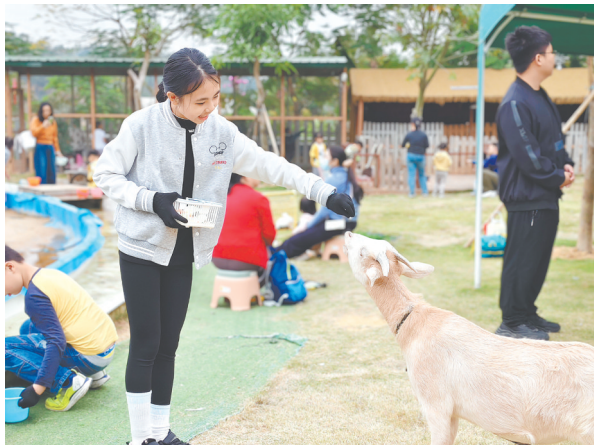
在江门版“疯狂动物城”里，小朋友与小动物亲密互动，感受现实中的童趣与奇妙。