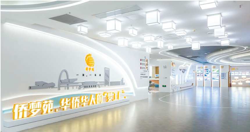
经过10年发展，江门“侨梦苑”已成为彰显江门侨乡优势、赋能区域高质量发展发展的核心引擎。图为核心区综合服务中心。

走进位于江海区的江门“侨梦苑”核心区，现代化厂房鳞次栉比，创新型企业在这里活力迸发。 江门“侨梦苑”始终将聚侨资、兴产业作为发展根基，通过搭平台、拓渠道、出政策的组合拳，为区域高质量发展筑牢硬支撑。核心区创设全市首个江门“侨梦苑”投资服务中心，提供税务、金融、产业等全链条服务，通过驻点招商、展会招商等多元方式，成功引进德昌电机、优美科等高端产业项目。2015年以来，核心区累计引进亿元以上侨资项目53个，计划投资额超350亿元，为区域经济发展注入了强劲动力。 “江门是一个干事创业的福地。”马来西亚侨眷、江门市方健康生物科技有限公司董事甘荣娇的感慨，道出了众多侨资企业扎根江门的心声。2019年，她被《江门“侨梦苑”核心区高质量发展若干政策措施》吸引，与团队在此创立公司，从事大健康领域研发。“‘侨梦苑’的服务专窗、‘侨资贷’等金融支持，尤其是高层次人才创业补贴，就像一场‘及时雨’，让我们在初创阶段能心无旁骛地搞研发。” 从“搭平台”到“拓渠道”，江门“侨梦苑”不断升级引资体系，以侨引商、以商引商的涟漪效应持续释放。与香港江门总商会等缔结战略合作，聘请侨商为“招商合伙人”；借助侨团网络，推动江海无人机等产品“出海”加拿大；开展涉侨推介活动超30场……一条以侨引侨、以侨联外的开放之路越走越宽。 10年来，这里从最初的蓝图规划，到如今侨资企业林立，江门“侨梦苑”核心区发生了翻天覆地的变化。据统计，核心区现有侨资企业589家，较10年前数量接近翻一番，其中高新技术企业、科技型中小企业、创新型中小企业数量实现了翻倍增长。