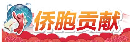
□文/图 江门日报记者 吴健争

在恩平市，大街上经常可以看到“委国货运”“委国空运”等字样，这背后是恩平与委内瑞拉千丝万缕的联系。如今，恩平旅委华侨华人超20万人，占恩平海外侨胞总数的约三分之一，相当于恩平市常住人口的约四成……恩平籍侨胞融入当地已逾百年，从老一辈的开荒拓土，到中生代的稳业深耕，再到新生代的创新破局，逐渐成为推动当地发展、绘就中委交流新图景的重要力量。