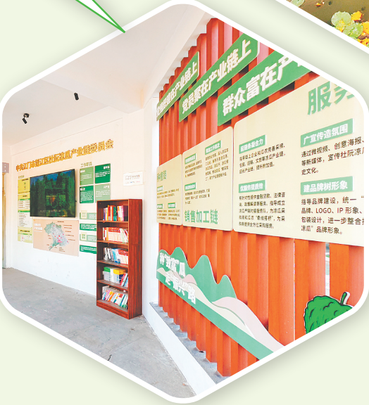
走进上巷村,一条亮丽的“彩虹道”蜿蜒其间。