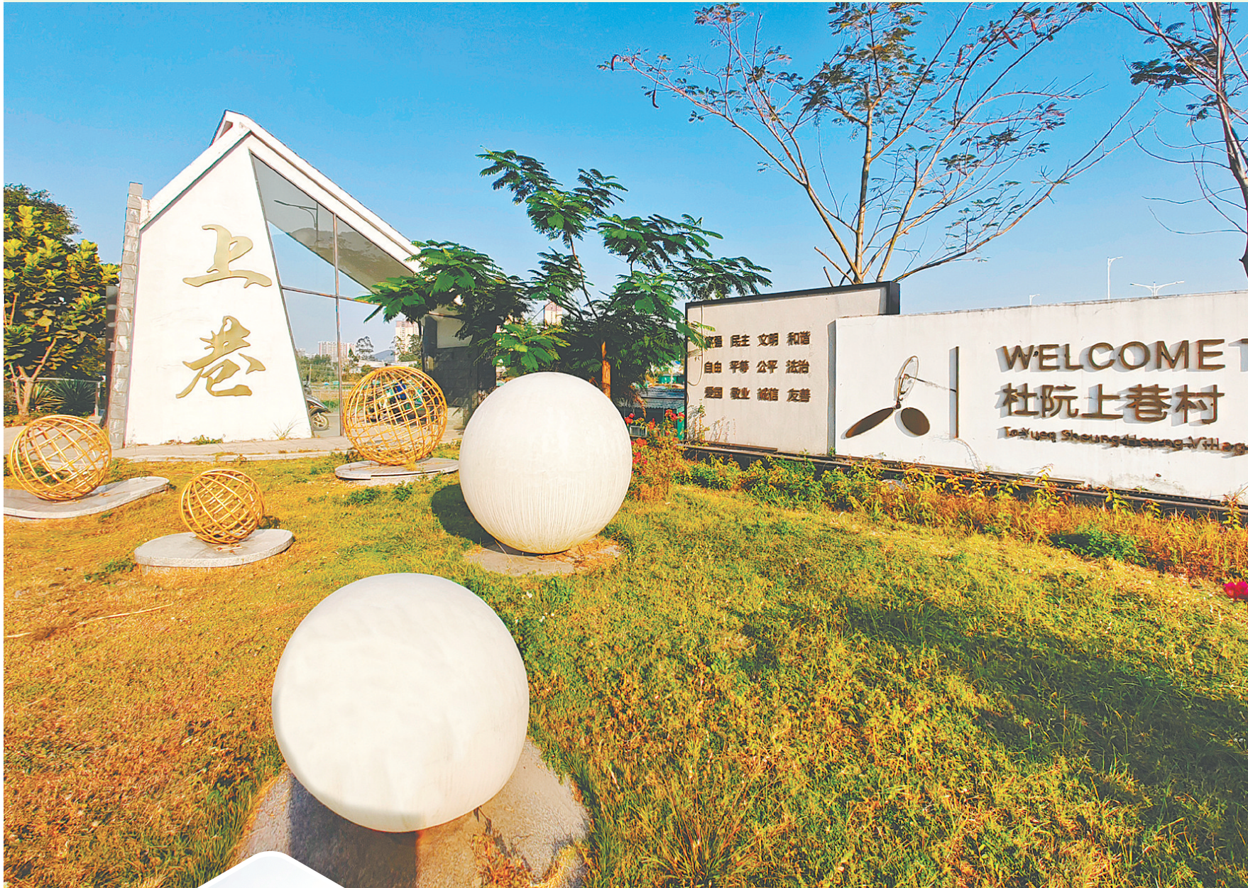
近年来,上巷村以典型村建设为契机,推进和美乡村建设,切实提升了村民的获得感与幸福感。