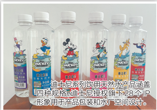
迪士尼系列饮用天然水产品涵盖四种规格，迪士尼授权旗下28个IP形象用于产品包装和水厂空间设计。

在服务保障方面，恩平构建“一站式+个性化”服务体系，让人才就业更舒心、企业用工更省心。针对来恩平求职的青年人才，4家“青年人才驿站”提供一年不超过12天的免费住宿，“志愿时光抵租计划”以志愿时长减免房租餐费，有效缓解青年人才租房压力。此外，恩平成立青年创业协会，推动4家金融机构专项授信20亿元，为创业人才提供融资支持。