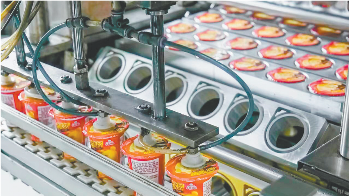
滨崎食品全力冲刺年货销售旺季。

据统计,江门现有饼干生产企业67家,已形成以广东嘉士利食品集团有限公司(以下简称“嘉士利”)、江门市澳新食品有限公司(以下简称“澳新食品”)、知美屋食品有限公司(以下简称“知美屋食品”)等为代表的龙头企业集群,产业规模与品牌影响力位居全国前列。