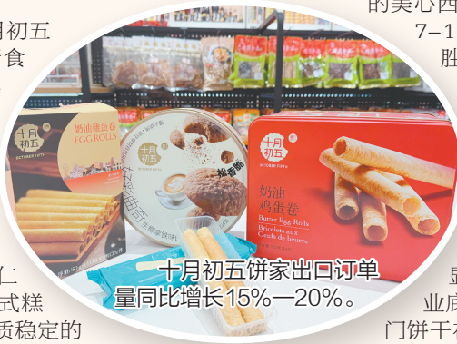
十月初五饼家出口订单量同比增长15%—20%。

如今,江门已成为“国家新型工业化产业示范基地(食品)”和“中国食品工业生产基地”,产业集群效应显著。这份深厚的产业底蕴与文化积淀,是江门饼干在年货市场上经久不衰的基石。