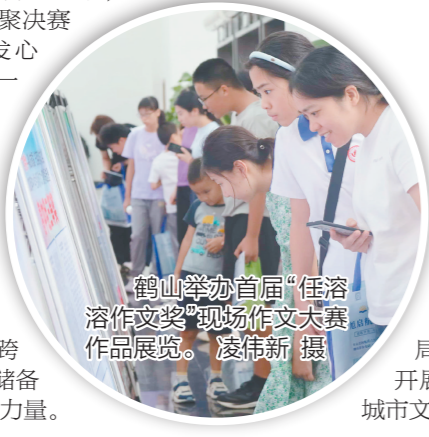
鹤山举办首届任溶溶作文奖现场作文大赛作品展览。

“任溶溶童书嘉年华”的核心在于“儿童”，鹤山市立足儿童视角，紧扣儿童成长需求，构建起集阅读启发、情感培育、能力提升于一体的多维成长平台。活动以“互动温馨”与“亲子共读”为亮点，打造了一系列特色环节：《开心锤锤》名家分享会以趣味百科点燃孩子想象力；《西游记》亲子共读会通过角色扮演让经典IP“活起来”；《木偶奇遇记》主题阅读依托绘本传递诚实守信的成长理念。此外，“高情商智慧父母”专题讲座从家长维度发力，倡导以共情、尊重构建健康亲子关系，让书香成为维系家庭情感的温暖纽带。这些活动注重参与感、体验感与分享感，在轻松愉悦的氛围中为孩子们播下热爱阅读、拥抱生活的种子。 值得关注的是，鹤山市创新将阅读推广与创作激励相结合，在任溶溶后人及顾问的授权与冠名支持下，举办首届“任溶溶作文奖”现场作文大赛，覆盖鹤山全市各中小学，380名“小作家”齐聚决赛赛场，用笔尖抒发心声、展现才华。这一举措既是对任溶溶文学精神的传承致敬，也为本土青少年搭建了高规格的文学展示与成长平台，助力青少年实现从“阅读者”到“思考者”“表达者”的跨越，为“书香鹤山”储备了坚实的未來创作力量。