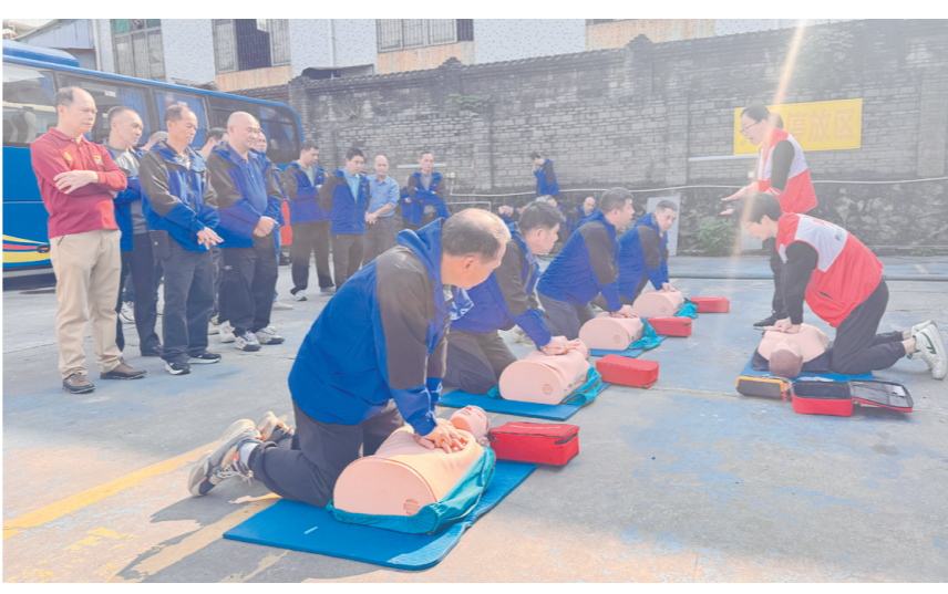
讲师围绕心肺复苏（CPR+AED）展开教学，货运司机参与实战演练。

机通过佩戴“醉驾模拟眼镜”，亲身体验酒后驾驶的危险性与失控感，学习公交车、货车应急阀门的位置及操作方法，并掌握使用安全锤破窗的正确方法。在急救技能实战演练环节，讲师围绕心肺复苏（CPR+AED）展开教学，对货运司机提供“一对一”指导，从判断意识、紧急呼救、规范胸外按压到人工呼吸，确保每一步操作都严谨规范。此外，讲师针对行车途中可能发生的气道异物梗阻等紧急情况，演示了适用于驾驶场景的“海姆立克急救法”应用技巧，让货运司机能够更直观地掌握急救要点。 鹤山市红十字会相关负责人表示，接下来将进一步加强与交通执法部门的协同联动，持续开展应急救护培训，推动急救知识普及及深入行业一线，让更多“第一目击者”转化为“第一救援力”，为新业态从业者筑牢生命健康防线。