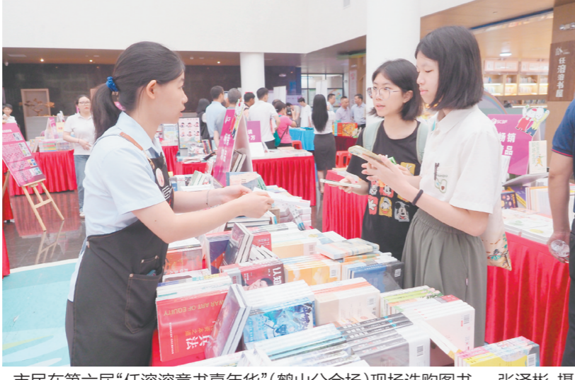
市民在第六届“任溶溶童书嘉年华”（鹤山分会场）现场选购图书。

第六届“任溶溶童书嘉年华”（鹤山分会场）获评“2025南国书香节优秀文化活动”荣誉的背后，是鹤山市构建“全域书香”立体布局的系统性实践。鹤山市打通县、镇、村（社区）三级联动渠道，全力畅通书香惠民“最后一公里”，以“全覆盖、广辐射”为原则，构建起多层次活动网络：以鹤山文化中心