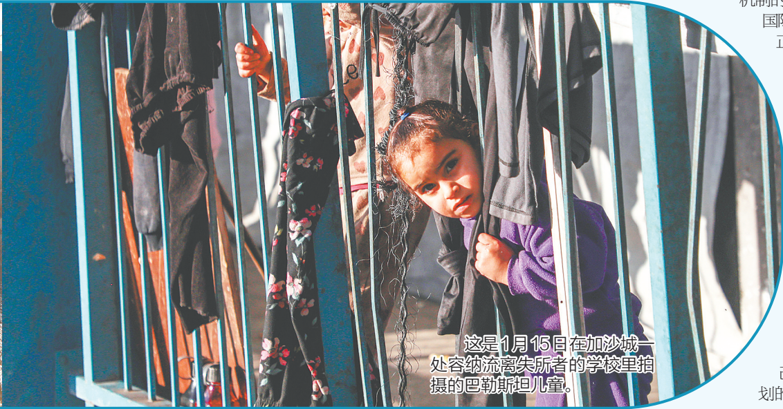
这是1月15日在加沙城一处容纳流离失所者的学校里拍摄的巴勒斯坦儿童。