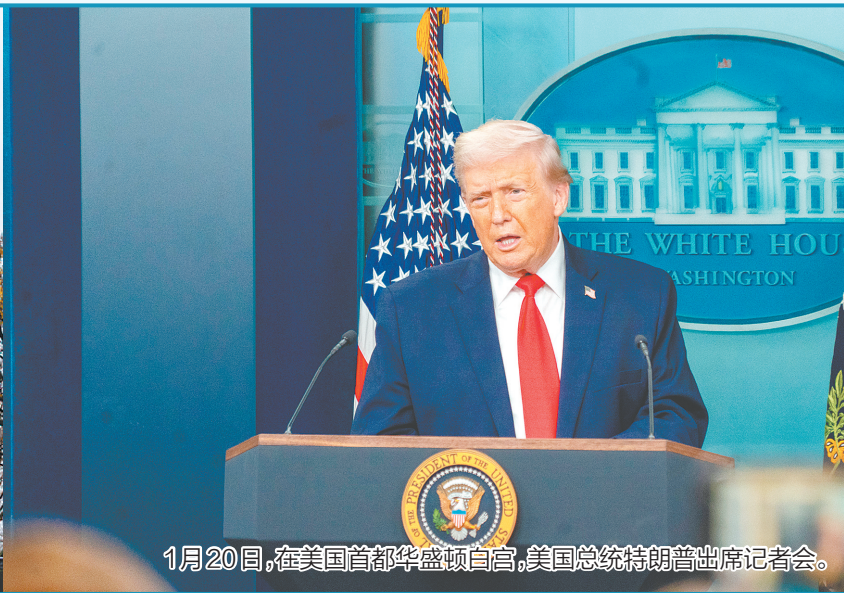
1月20日,在美国首都华盛顿白宫,美国总统特朗普出席记者会。