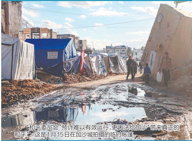
“和平委员会”预计难以有效运行,更无法给加沙“带来真正的和平”。这是1月15日在加沙城拍摄的临时帐篷。

沙特阿拉伯利雅得政治和战略研究中心研究员阿卜杜勒·阿齐兹·沙巴尼说,参与维护地区和平稳定本应是各国政治和道义责任,但美方却将其用作获取财务资源的途径,这种做法“削弱了国际合作的价值,令参与国感到自己只不过是美方既定规划的出资方”。