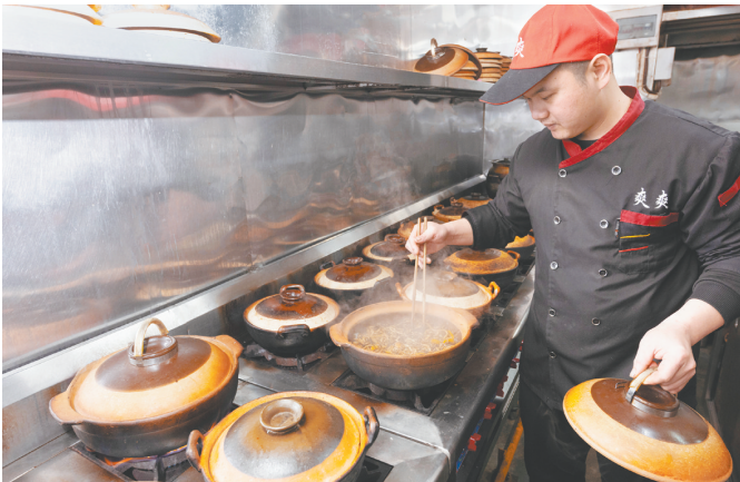
►“爽爽黄鳝饭”是下洞村宝兴圩的41年老字号,也是市级非遗“台山黄鳝饭制作技艺”代表性店铺。

双龙自然村是下洞村传统民居保留最为完整的区域,村中有“耀庐”“壁庐”两座洋楼,以及居仁别墅(敬庐)、步云书舍等建筑。这些建筑距今已有100多年历史。