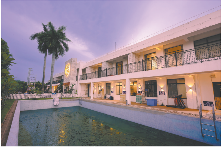
下洞村引入“侨汇里”项目,打造水步文旅中转站。