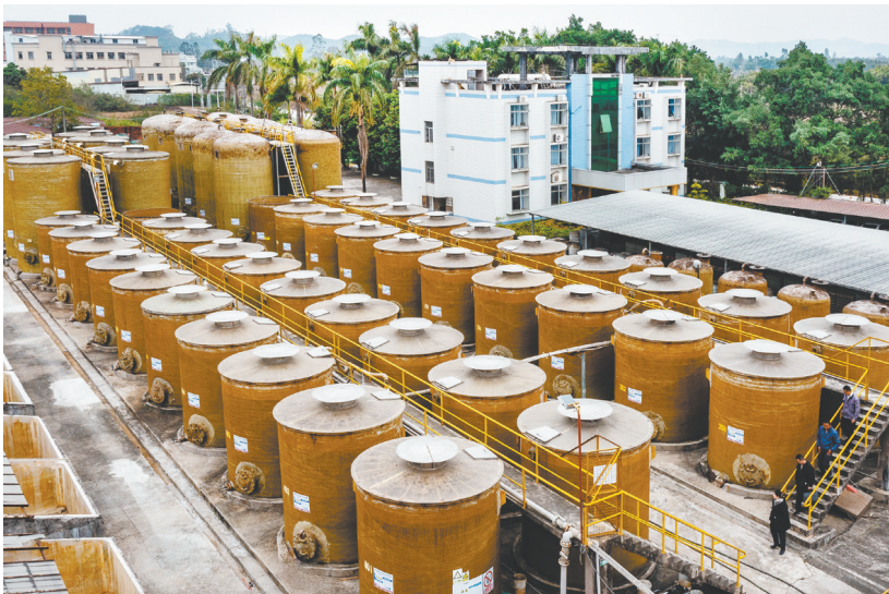
►位于下洞村的台山市味皇调味品食品有限公司是现代调味品生产销售企业,也是国内调味品核心生产与出口基地。