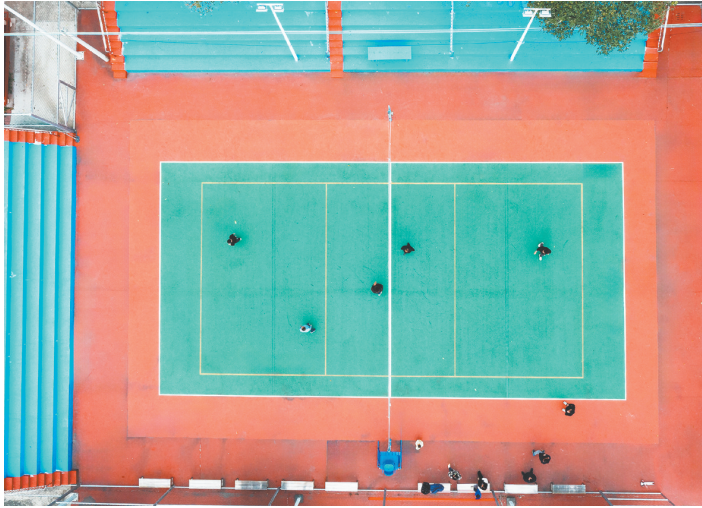
下洞村持续改善人居环境,完善村内休闲健身设施。