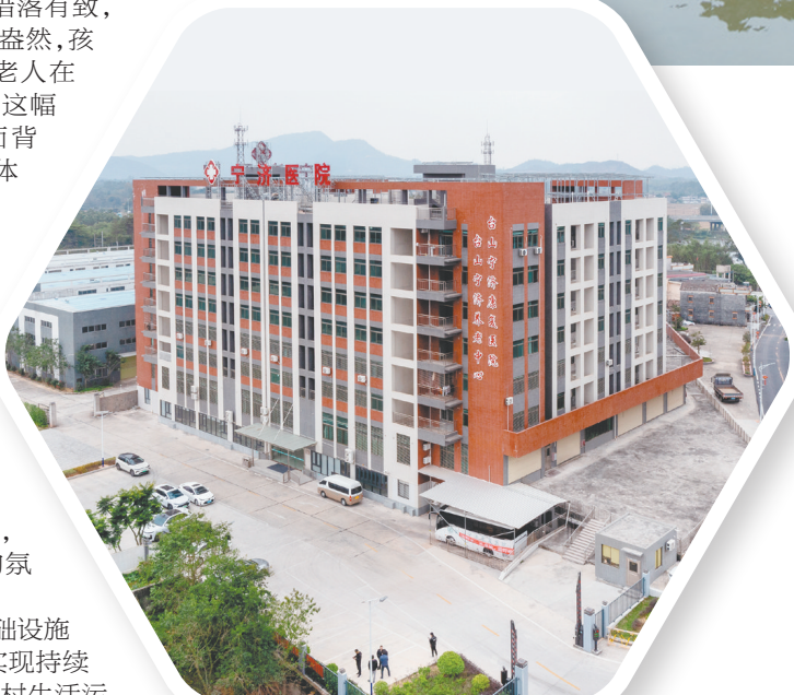
▲台山市宁济康复医院是2024年8月成立的民营二级专科医院,为江门市医保定点机构。

双龙自然村是下洞村传统民居保留最为完整的区域,村中有“耀庐”“壁庐”两座洋楼,以及居仁别墅(敬庐)、步云书舍等建筑。这些建筑距今已有100多年历史。