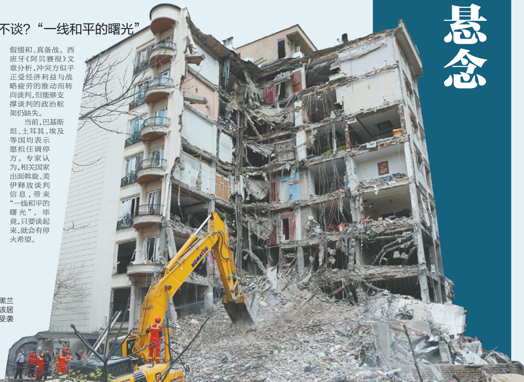
这是3月23日在伊朗德黑兰一处居民区拍摄的被毁建筑，该居民区曾在美以军事行动中遭受袭击。

当前，巴基斯坦、土耳其、埃及等国均表示愿担任调解方。专家认为，相关国家出面斡旋，美伊释放谈判信息，带来“一线和平的曙光”。毕竟，只要谈起来，就会有停火希望。