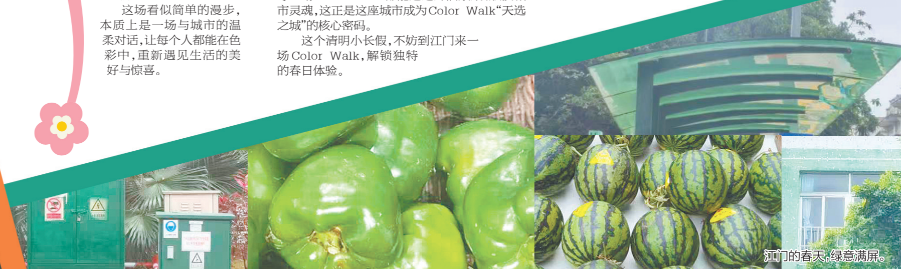
江门的春天,绿意满屏。