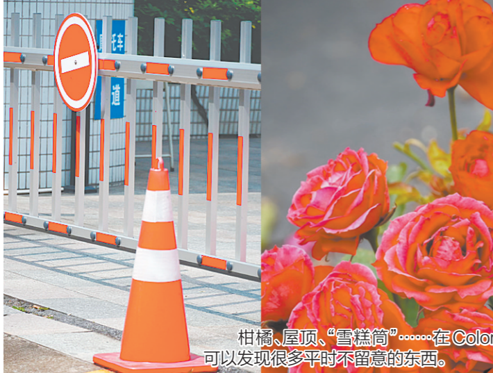
柑橘、屋顶、“雪糕筒”……在Color Walk中可以发现很多平时不留意的东西。