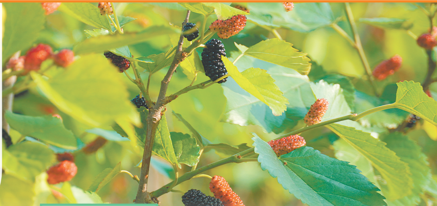
紫红色的桑葚让人垂涎欲滴。