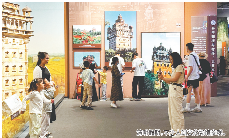
清明假期，不少人到文化场馆参观。

作为拥有530多万港澳台同胞和海外侨胞的中国侨都，江门近年来积极“引进来”“走出去”，推动文旅产业高质量发展。广东首批入境游精品线路自2025年10月上线以来，依托国际在线旅游平台全球传播优势精准宣推，带动江门入境游客与消费金额双增长。江门还联动澳门举办世界文化遗产嘉年华，推动开平碉楼—赤坎华侨古镇打造世界级旅游景区；与港澳合作引进专题展览、开展“大湾区青年实习计划”，深化粤港澳青少年交流；组织文旅企业亮相澳门、香港国际旅游博览会，签订旅游合作协议，共塑大湾区文旅品牌。同时，