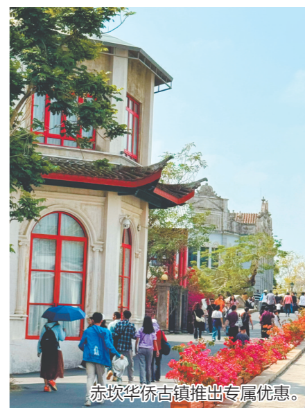
赤坎华侨古镇推出专属优惠。

江门日报讯当前，粤BA赛事正火热上演，赛场内外激情涌动。作为江门的“顶流”文旅项目，赤坎华侨古镇为前来观赛的湾区邻居送上专属福利，让球迷们在看球助威之余，能沉浸式感受侨乡古镇的独特魅力。