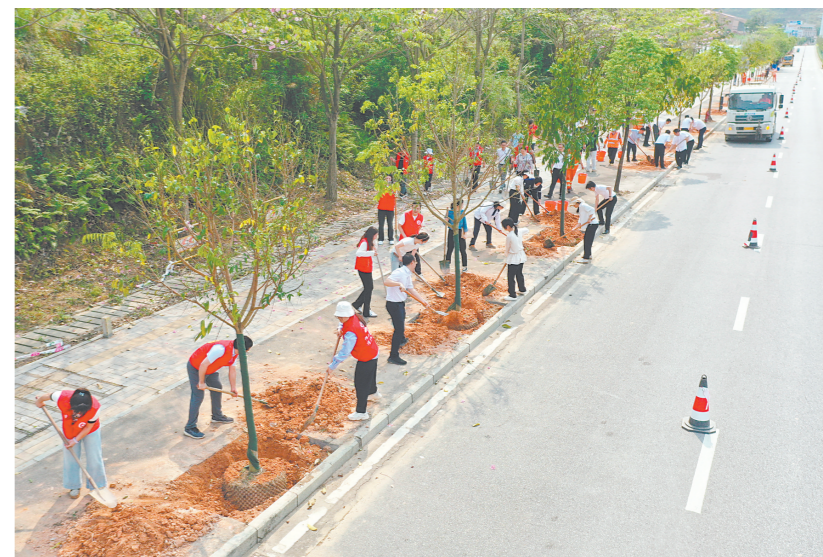
杜阮南路新栽种的树苗挺拔茁壮,为城市道路披上绿装。

江门日报讯(记者/朱磊磊)春风催新绿,植树正当时。为深入贯彻落实市委关于绿美江门生态建设的部署,4月10日下午,江门市委办、蓬江区委办负责同志、党员代表积极响应认捐植树行动,在杜阮南路开展义务植树主题党日,以实际行动增绿添彩,持续提升道路绿化品质,为林荫大道建设夯实基础。 今年以来,江门全面推进林荫大道建设,聚焦城市主干道绿化提质,着力打造“一路一景、绿树成荫、舒适宜人”的道路绿廊,不断提升城市生态品质与宜居水平。杜阮南路是江门市重点打造的林荫大道路段,此次市委办、县委办系统开展植树共建主题党日,是江门市委办深化“红色服务链”党建品牌,带头共植林荫