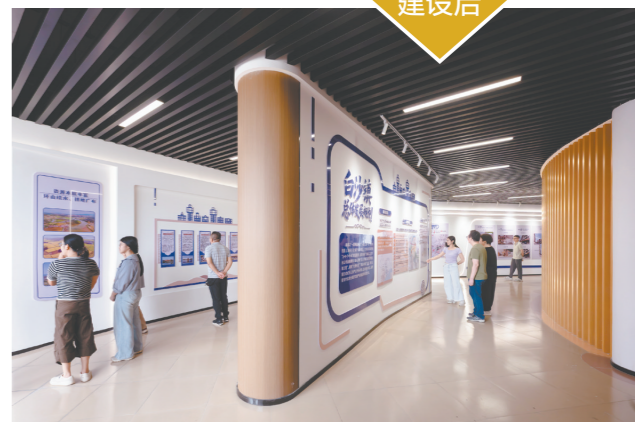
建成后的党群服务中心(美丽客厅)。