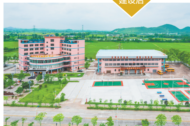
建成后的体育馆外球场。