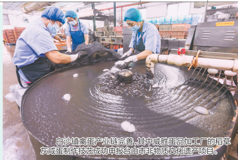
白沙镇禽蛋产业链完善,其中威胜蛋品加工厂的稻草灰咸蛋制作技艺成功申报台山市非物质文化遗产项目。