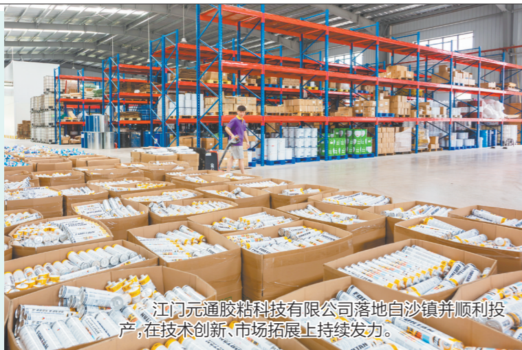
江门元通胶粘科技有限公司落地白沙镇并顺利投产,在技术创新、市场拓展上持续发力。