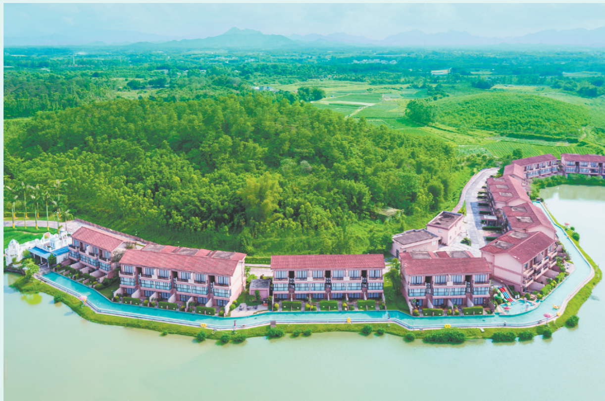
→台山康桥温泉度假村是国家4A级景区,占地60000平方米,内设四大主题温泉区、动感区(水上乐园)、欧陆休闲区、康桥养生区等。