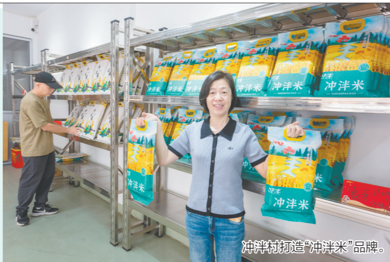
冲洋村打造“冲洋米”品牌。