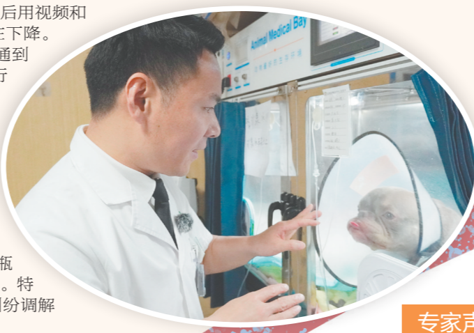
宠物医生检查小狗“患者”的情况。

江门市农业农村局相关负责人表示,将继续严格落实兽医备案管理,深化“双随机、一公开”检查,探索引入第三方专业力量推动建立宠物医疗纠纷鉴定与调解机制。