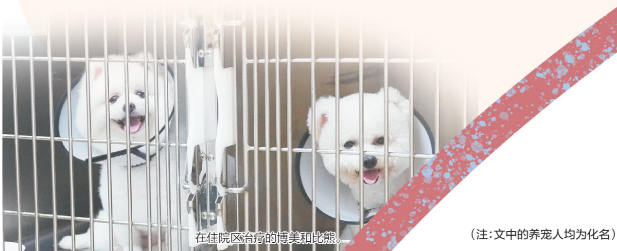
在住院区治疗的博美和比熊。

当它们生病时,我们能回报什么?我们需要更完善的监管标准,让每一家宠物医院都有章可循;需要更透明的收费机制,让每一个养宠家庭都能量力而行;需要更专业的纠纷调解渠道,让医患之间不再“各说各话”。那么,它们用一生陪伴,我们用什么回应?答案,或许就藏在行业规范化的每一步进程里,藏在每一次精准的诊断里,藏在每一次温暖的就医体验里。让它们被温柔以待,不仅是对一份情感的尊重,更是对一个社会文明程度的丈量。