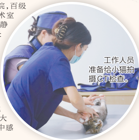
工作人员准备给小猫拍摄CT检查。

外科动物医院,百级层流净化手术室的指示灯安静地亮着。院长郭振刚正在查看一只金毛的术后情况。这间手术室是江门地区首间达到人医标准的层流净化手术室,能大大降低宠物术中感染风险。