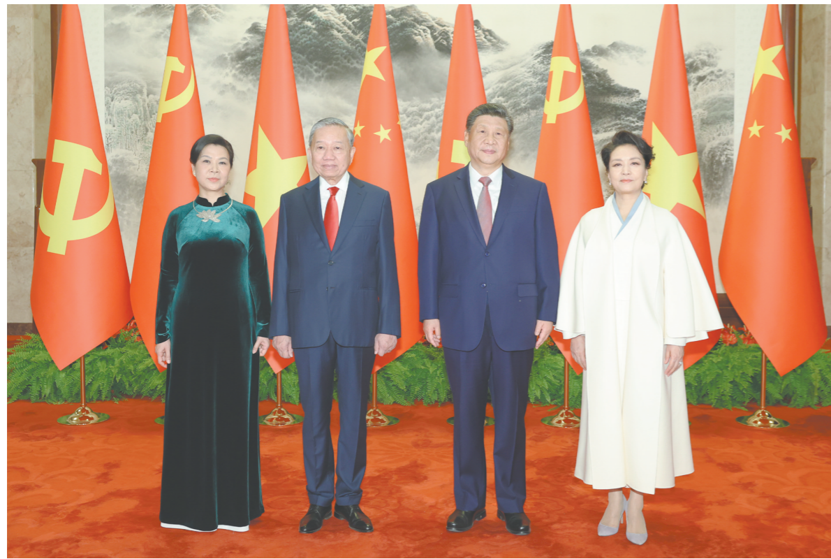
4月15日上午,中共中央总书记、国家主席习近平在北京人民大会堂同来华进行国事访问的越共中央总书记、国家主席苏林举行会谈。这是会谈前,习近平和夫人彭丽媛同苏林和夫人吴芳瑞合影。

新华社北京4月15日电 4月15日上午,中共中央总书记、国家主席习近平在人民大会堂同来华进行国事访问的越共中央总书记、国家主席苏林举行会谈。