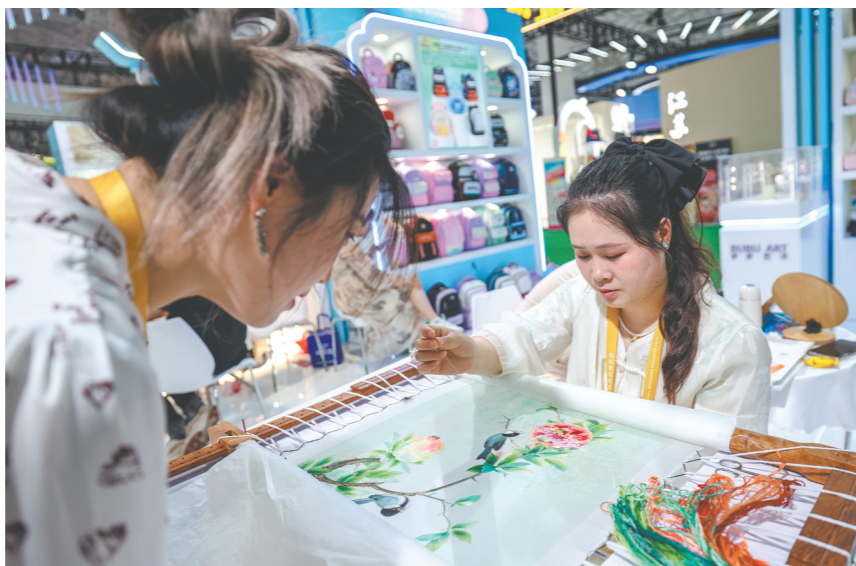
4月14日，观众在第六届消博会上观看参展商绣制湘绣。

吉尔吉斯斯坦经济学家沙尔舍耶夫说，海南自由贸易港封关运作具有重要意义。结合消博会平台，海南提供了检验新贸易模式、吸引投资和优化供应链的“实实在在的机制”。