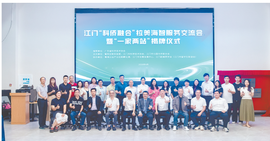
本次活动搭建了中拉科技交流的平台。

“智网互联实验室海智工作联络站”和“江门海智工作联络站”正式揭牌,成为江门链接拉美资源、服务海外科技工作者的重要实体平台,为中拉科技交流合作提供坚实支撑。