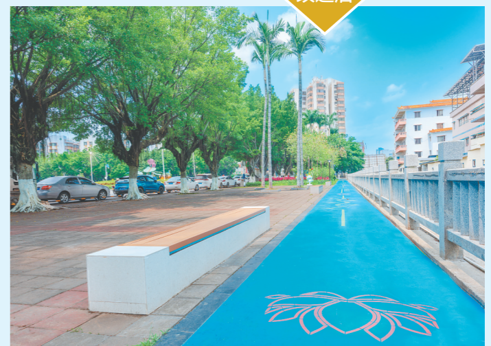
圩镇美丽河道全长1600米，沿岸已建成生态公园和亲水碧道，成为村民日常休闲散步的好去处。