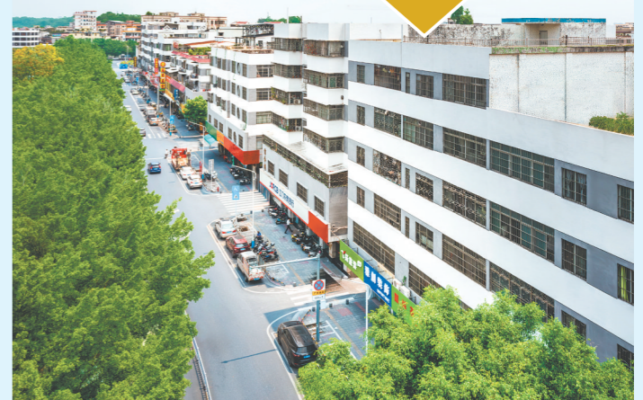
荷塘镇大力实施圩镇房屋外立面提升工程，推动沿街风貌整体提升。