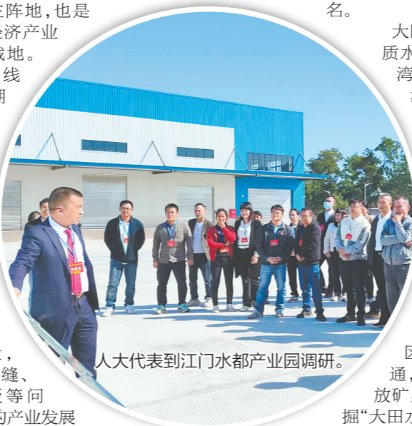
人大代表到江门水都产业园调研。

下一步，恩平市人大常委会将精心组织开展好“助力优化营商环境·人大代表在行动”主题活动，引导全市各级人大代表继续聚焦优化营商环境，深入基层听民意、精准建言献良策，强化监督促落实，以“人大之为”凝聚发展合力，以“代表之能”护航高质量发展，为恩平加快融入粤港澳大湾区、奋力谱写现代化发展新篇章作出新的更大贡献。