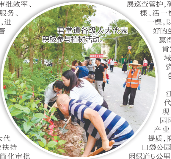
君堂镇各级人大代表积极参与植树活动。