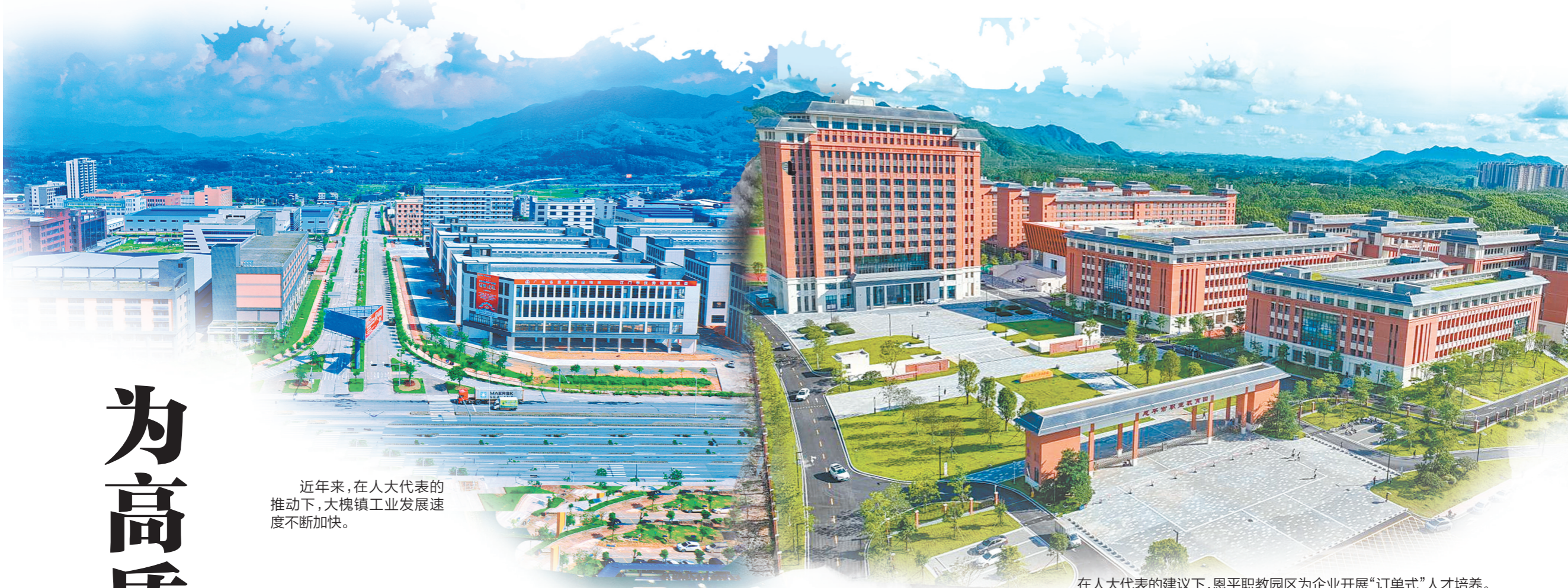
近年来，在人大代表的推动下，大槐镇工业发展速度不断加快。