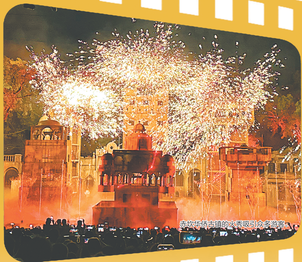
赤坎华侨古镇的烟火吸引众多游客。