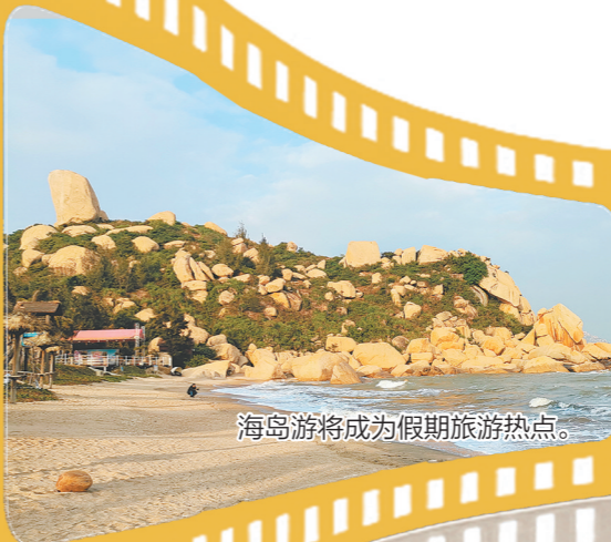
海岛游将成为假期旅游热点。