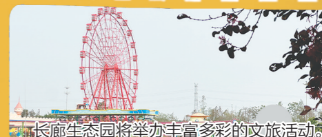
长廊生态园将举办丰富多彩的文旅活动。