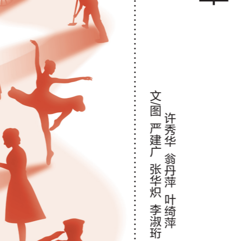
开平劳模工匠创新工作室