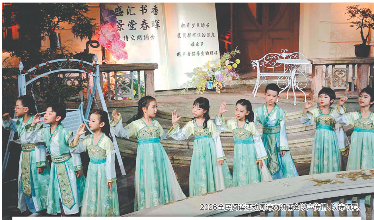
2026全民阅读活动周诗朗诵会以声传情,以诗颂爱。