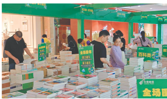
2026年新会区“书香润葵乡 悦读伴成长”全民阅读活动吸引不少市民驻足。