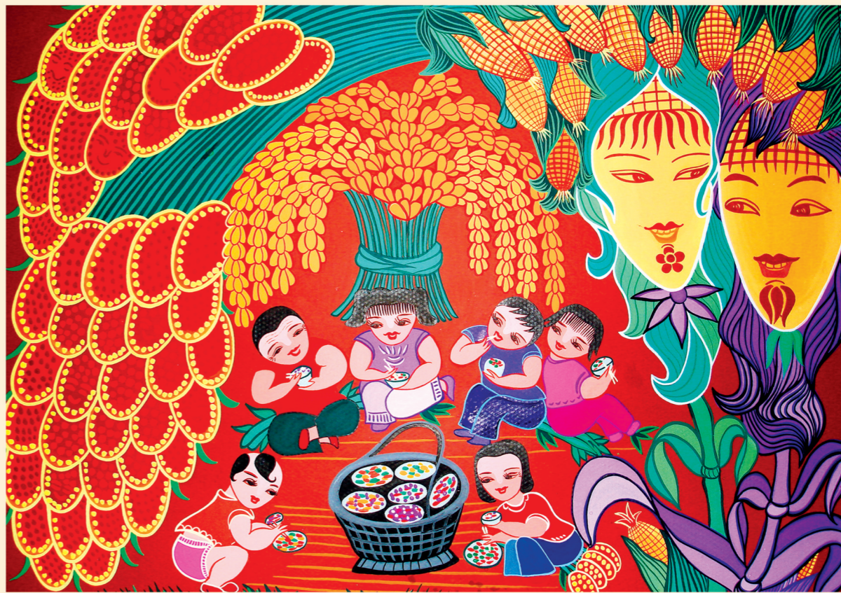
丽达民间文化艺术工作室 赵丽达作