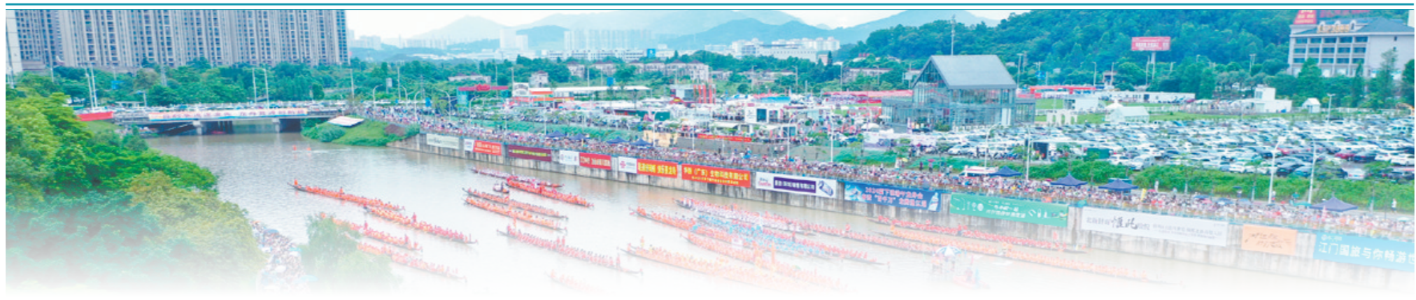
又是一年龙舟竞渡时。

如今,随着时代的发展,滚铁环渐渐淡出了人们的视线,取而代之的是各种各样的电子产品。但每当我想起那个在阳光下滚动的铁环,想起和小伙伴一起嬉戏玩耍的场景,心中就会涌起一阵温暖和甜蜜。那滚动的铁环,不仅承载着我们儿时的欢乐,更见证了我们无忧无虑的童年,它是我生命中最美好的记忆,永远不会褪色。