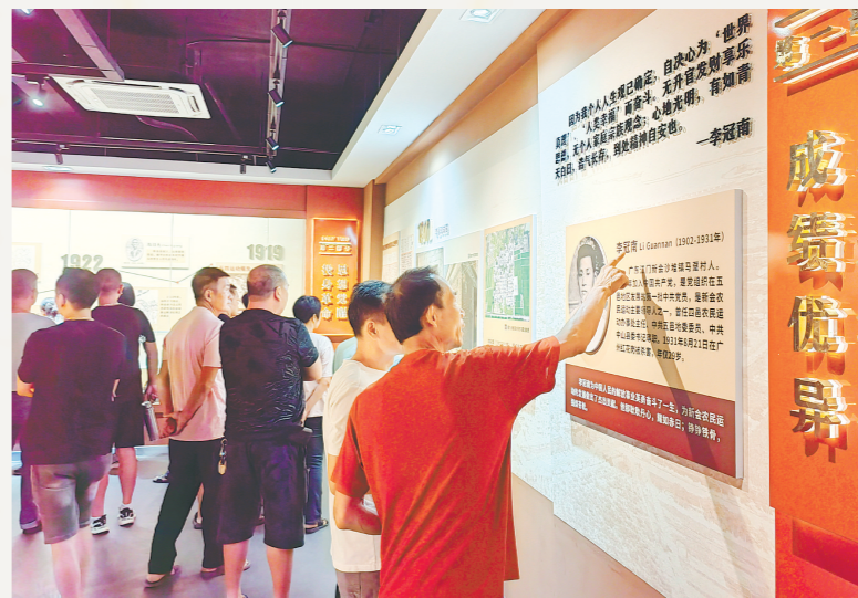
李冠南事迹吸引了不少游客前来参观学习。

身为华侨子弟，李冠南舍弃安逸，始终把人民利益放在首位，将全部身心投入到解放劳苦大众的事业中，发动农民、组织农会、减租减息，保护群众免遭报复，为人民挣脱黑暗而不懈斗争。这种舍弃小我、造福人民的抉择，深刻诠释了“践行初心、担当使命”的核心要义。