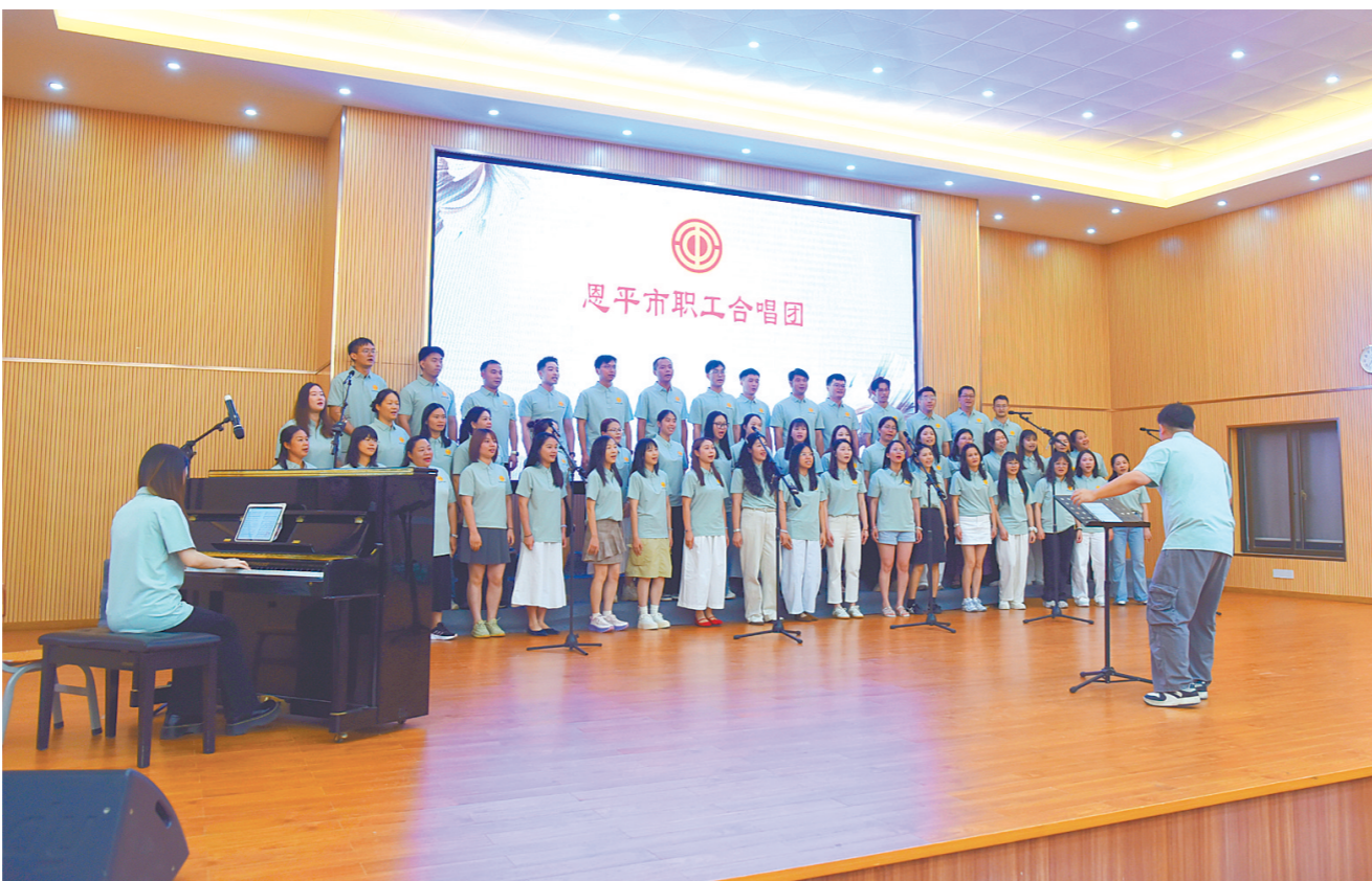
新成立的恩平市职工合唱团现场演唱了粤语经典歌曲《万水千山总是情》,以歌声宣告合唱团正式扬帆起航。

5月30日,恩平市职工合唱团正式成立。该合唱团由恩平市总工会和恩平市文联共同组织成立,由来自各行各业的普通职工组成,他们将在专业音乐教师的带领下勤练唱功提本领,走进基层开展公益展演和慰问演出,用歌声传递力量,用和声凝聚人心,唱响新时代劳动者的奋斗之歌。