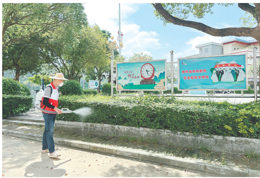
恩平市各镇(街)集中开展环境卫生整治、病媒生物防治、健康知识宣传等行动,筑牢公共卫生安全防线。

君堂镇以“全域覆盖、不留盲区、不留死角”为目标,组织镇村干部、党员志愿者、群众代表全面出击,对村道巷道、房前屋后、沟渠池塘、田间地头、公共区