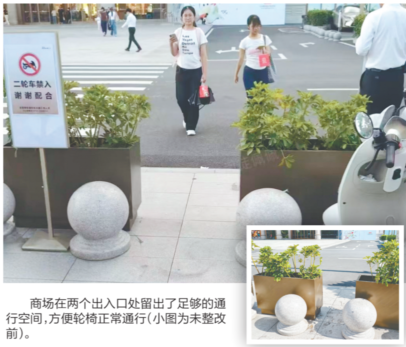
商场在两个出入口处留出了足够的通行空间,方便轮椅正常通行(小图为未整改前)。