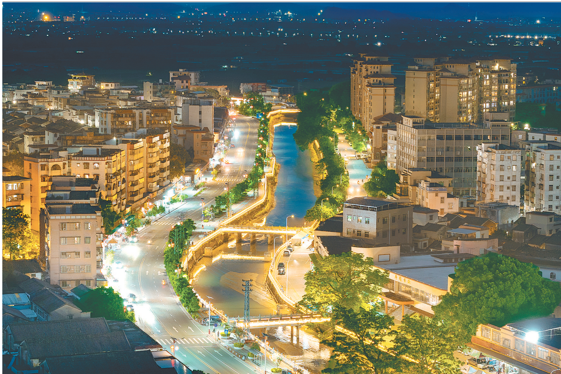
沙堆镇“一河两岸”夜景。