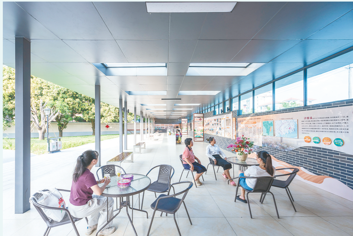
圩镇客厅集侨史展示、招商、服务于一体。