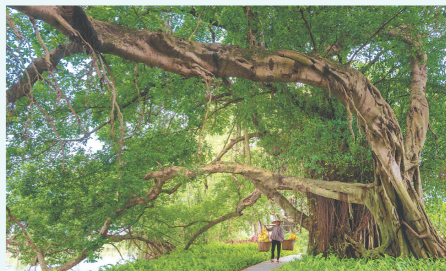
在独联村大坑里百年榕树林,有9棵树龄超过150年的古榕树连成一片,绿荫如盖。