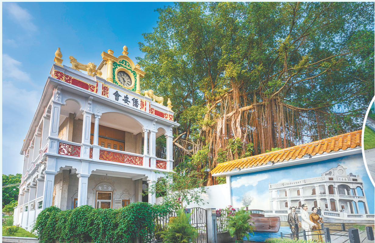
沙堆侨安会是沙堆镇百年“侨”地标。