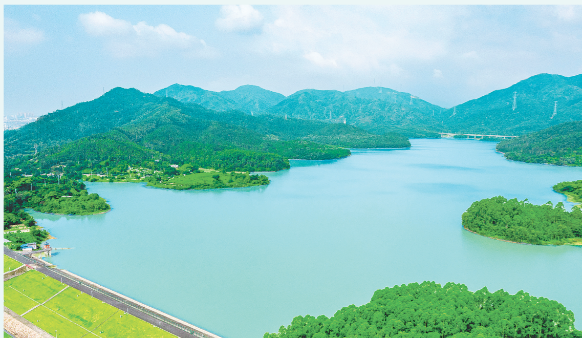
梅阁水库库区依托水源林改造深化绿美生态建设。