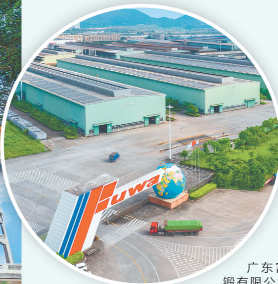
广东富华铸锻有限公司是沙堆镇先进装备制造行业代表性企业。