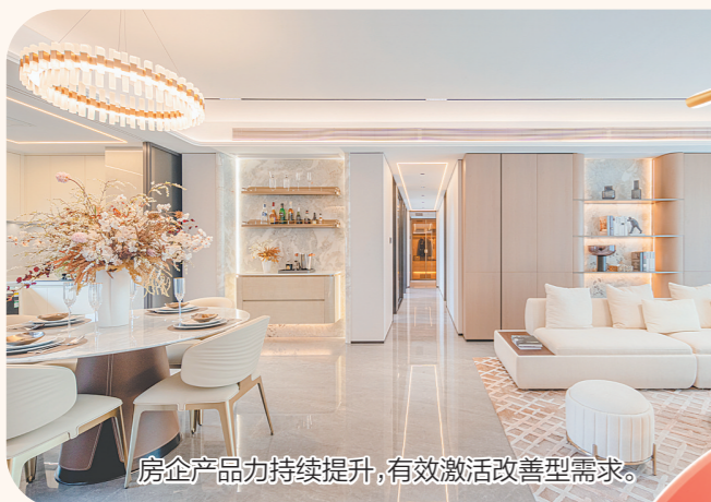
房企产品力持续提升，有效激活改善型需求。