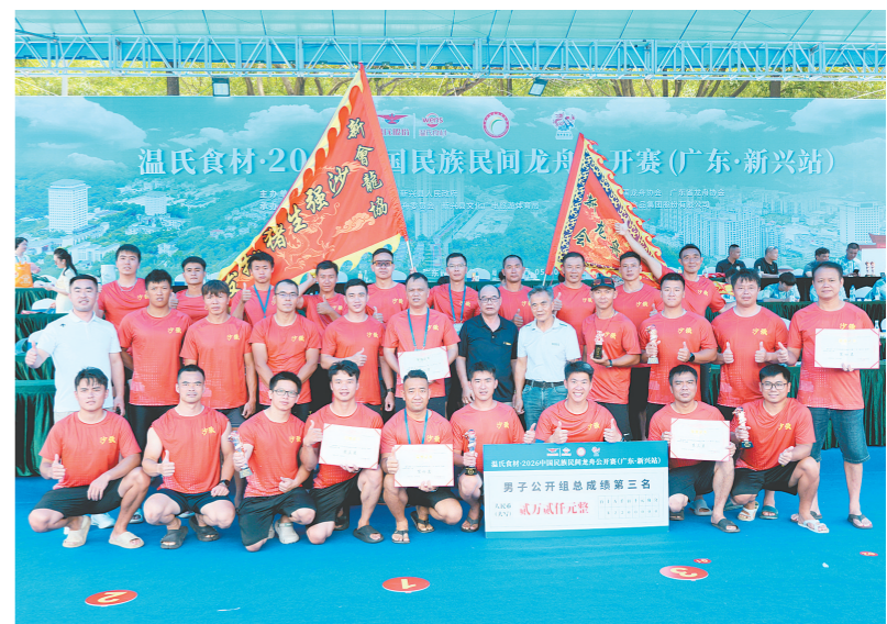
新会龙舟健儿首次参赛便获得佳绩。

江门日报讯(文/图 记者/简家琳 通讯员/新会宣)昨日,记者从新会区文广旅体局获悉,新会区龙舟队首次参加2026中国民族民间龙舟公开赛(广东·新兴站)斩获赛事总成绩第三名,展现了新会龙舟健儿风采。