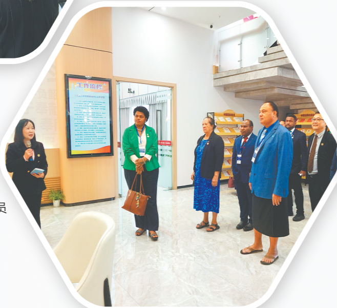
→太平洋岛国的议员和官员参访江海基层立法联系点。