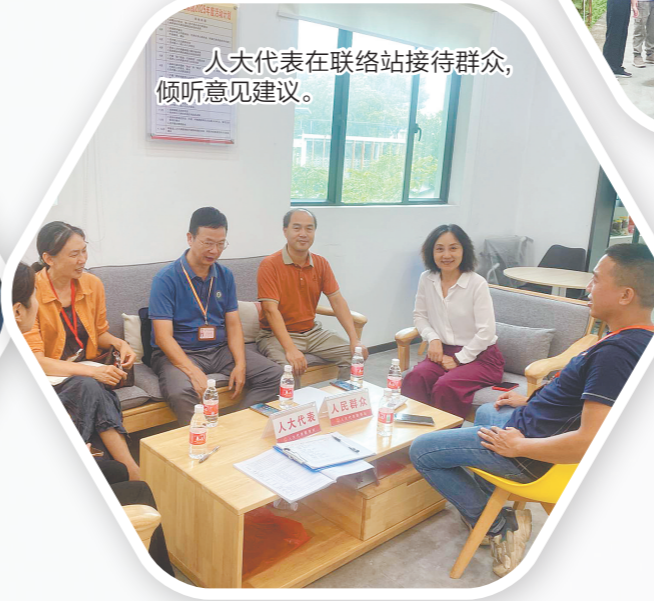
人大代表在联络站接待群众，倾听意见建议。