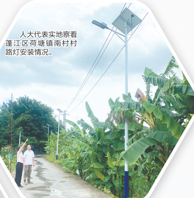
人大代表实地察看蓬江区荷塘镇南村村路灯安装情况。